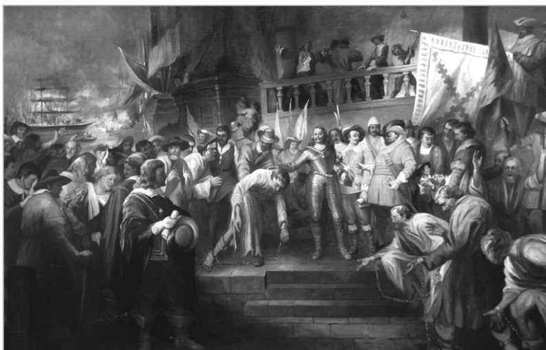
Tamássy Miklós: Ruyter admirális az Eendracht hajón fogadja a Nápolyban kiszabadított magyar prédikátorokat