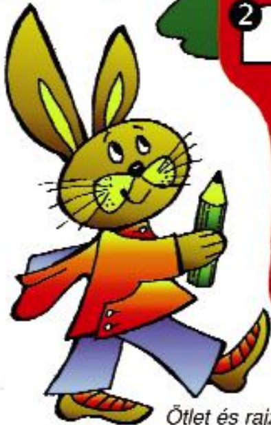
Ötlet és rajz: Solymosi Xénia