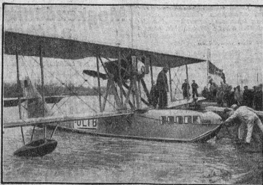
Április elsején indult meg a légi forgalom a Trieszt-Venecia-Milano-Turin-vonalon, amelyet 3 óra 45 perc alatt tesz meg a hidroplán. Képünk a repülőgép megérkezését ábrázolja Velencében.