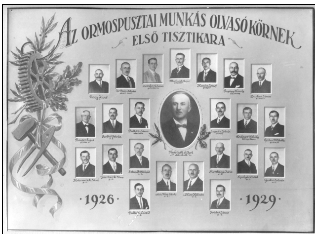
Az olvasókör első vezetősége.

A könyvtár anyagában a már említett Shakespeare-drámákon kívül ott volt néhány magyar (Katona József: Bánk bán , Madách Imre: Az ember tragédiája , Szigligeti Ede: Színművek ) és külföldi (Ibsen: Per Gynt , G. B. Shaw: Barbara órnagy , Molière: Fösvény ) színmű is, melyek tovább növelték az állomány értékét.