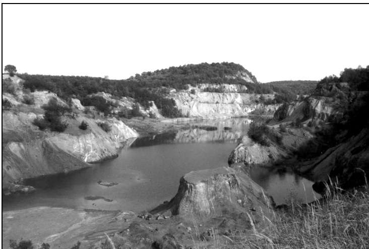
A rudabányai bányató, hazánk jelenlegi legmélyebb állóvize (kb. 60 m).

Kortársai, barátai és pályatársai abban a szellemben szólnak, s úgy – ahogyan az egy Cs. Varga István -i formátumhoz illik. Vegyes műfajú írásokat olvashatunk, de koránt sem vegyes színvonalúakat. A dolgozatok szellemi szellentársak. Vagy azok próbálnak lenni. Emé – nem vásári – legendáriumban hasznos alkotótársak.