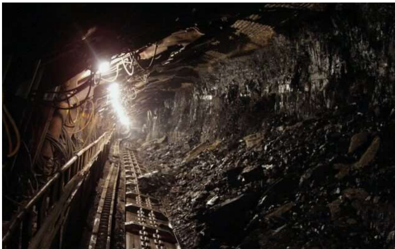
Földalatti bányarészlet a rézbányai uránérc bányából