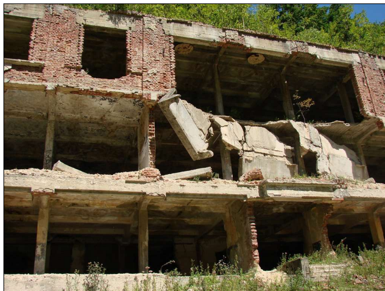
Az egykori uránérc bányaiüzem épületének romjai napjainkban.