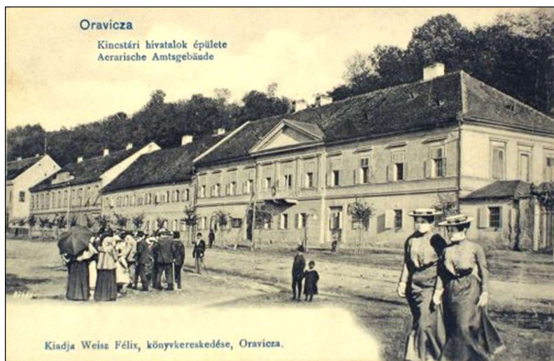
Az oravicai bányakapitányság épülete az 1900-as évek elején. (Képeslap.)