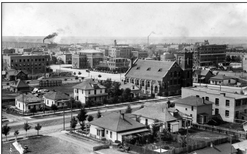
Lethbridge belvárosa 1911-ben.