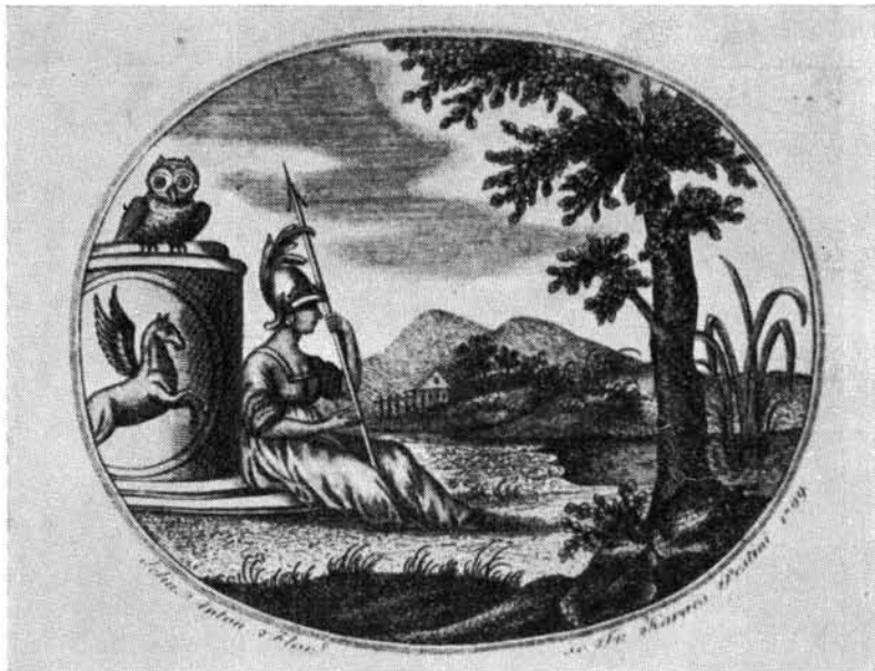
Magyar Minerva III. köt. Virág Benedek: Poétai munkái. Pest, 1799. Trattner M.

dés, hogy alkotott-e új betűtípust. Nem hisszük. Az ő érdeme a rendkívül pontos, gondos munkán kívül a különböző betűtípusok izléses kiválasztása volt. A rézmetsző technikában jól bevált és kedvelt finomvonalú betűket alkalmazta leginkább. Nagy szakmai gyakorlatát és művészi izlését tükrözi az a rengeteg írás, ami vésője alól kikerült. A kisebb-nagyobb terjedelmű magyarázó szövegek, a sok címfelirat, földrajzi elnevezés stb. Írása természetesen magán viselte szerszáma karakterét, általában finomvonalú, többször dekorált betűtípusokat alkalmazott és a betűrajzolás általános érvényű szabályait szem előtt tartva variálta az akkor használatos típusokat, főleg az antikva betűcsoport sorozatait (kurzív- és kézírásjellegűeket és azok díszváltozatait), a kezdőbetűket sokszor kiemelve, a címsorokat elütő tónusban a szövegtől és élt még más díszítő elemekkel is, mint amilyen a rovátkoló díszítés, a vonalak kettőzése, árnyalás stb. Azonban díszítgetései mellett is ment maradt a kilengésektől, izléstelenségektől és olyan műveket alkotott, amelyeket mai szemlélettel is szépnek, kiegyensúlyozottnak tarthatunk.