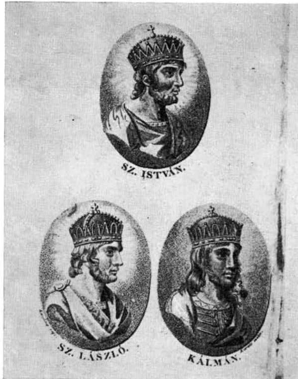
Fessler: A' három magyar nagy királyok' viselt dolgainak rajzolatja. Pest, 1815

Dugonics oszlopa a hasonló című vershez. 104 — A 9 × 15 cm-es kép átmenet az allegória és a címlap között: a költészet műzsája babérkoszo-