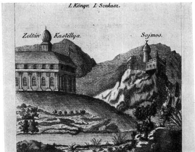
Dugonics: Jolánka c. műben

c. első költemény elé helyezett 9 \times 7,5 cm-es invokációs metszet a könyvdíszül alkalmazott korabeli rézmetszvények egyik jellegzetes szép darabja. Az ovális keretben elhelyezett szimbolikus alakok (múza, bagoly, pegazus) ahogyan a tájba bele vannak helyezve, levegős háttérrel, érdekes vonalas megoldással, fény és árnyalás jelöléssel igen hatásosak. 89