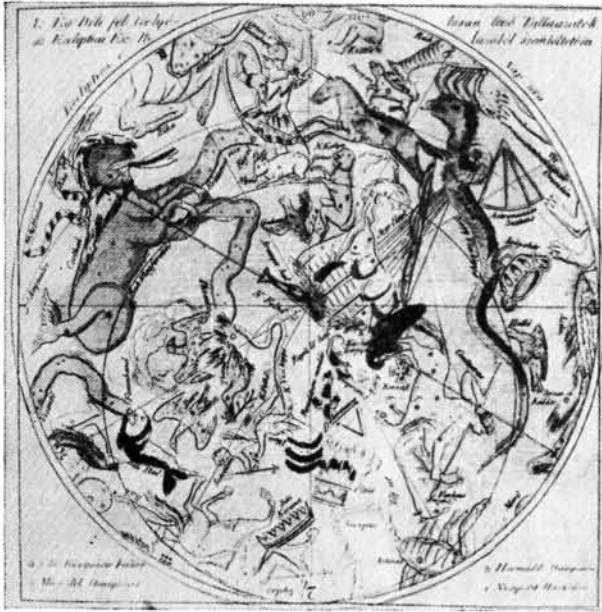
Katona Mihály: A' Föld' matematika leírása

A tervrajz mérnöki munka, arányos, szép elhelyezés, a metszésbeli kivitelezés hasonlóképpen szép munka, vonalas megoldásban. 51