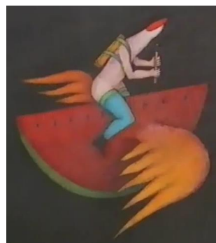
Szárnyaló fallikus ujj (?)