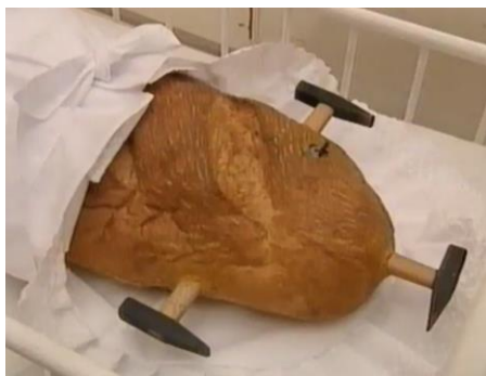
Kenyérrel táplált kalapács (?)

A címek utáni (?) jelzi, hogy azt mi adtuk (mivel az eredetét nem találtuk).