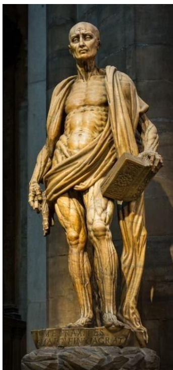
2. ábra. Szent Bertalan vállán lenyűzött bőrével és kezében nyűzókés és könyv 394

Szent István azért lehetett apostoli király, mert amikor Szűz Máriának felajánlotta az országot és ennek közjogi formáját is megadta, akkor valójában a korábbi gnosztikus keresztény hagyományokat követve járt el. Szent István állam- és egyházszerkezési munkája még nem jelenti azt, hogy egyértelműen hátat fordított volna például a gnosztikus keresztény tanoknak. Bár formájában ugyan elfogadta a Római Egyházhoz tartozást, aminek háttérében az a bölcs megfontolás állhatott, hogy ezzel véget vet a Kárpát-medencében az ariánus tanok üldözésén alapuló harcoknak, azonban ezzel a döntésével azt is elérte, hogy a független magyar állam tovább ápolhatta hagyományait, nem olvadt be a megálmódott nagy Európába. Bár a hivatalos nyelv a latin lett, a szentmisék szertartási nyelve is a latin lett, de vélhetően a magyar papok magyar nyelven prédikáltak a szószéken, és hirdethették a jézusi tanításokat.