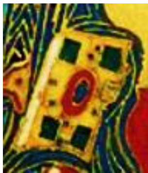
8. ábra Megváltó kezében lévő könyv, mint az 5-ös szám megjelenítése

Két szó tehát a kulcs, az IGE és az ÖRDÖG, amikor a Megszentelt Korona szerkezetét vizsgáljuk. IGE betűként elemezve: I hang (10-es szám) az isteni gazságot közvetíti le a Földre, a G hang (a 3-as szám) a gátak közötti gazdagodást hozza, az E hang (az 5-ös szám). Megváltó kezében lévő könyvön 5 jel van, ahol az 5.-et hangsúlyozva pirossal körbekerítették. Miért olyan fontos az 5-ös szám, illetve a vele analóg E hang? Az E hang egy olyan egyesítő és lényegkiemelő erő, ami által valamilyen új előd, az EGY jön létre.