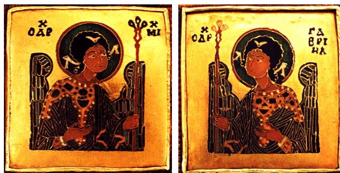
3. ábra. Angyalok a koronán a jobb és a bal agyfélteke működését szimbolizálják

Az angyalok kezében 3 ágú bot van, ami nem csak az Ég és Föld közötti közvetítés szimbóluma, ahol egyiknek sincsen értelme külön a másik nélkül, hanem a 3 ág a gazdagodásé is. A 3-as szám és a G hang jelentései állnak analógiában a platóni tanítások szerint. 400 A G hang jelentése a gátak közötti gazdagodás, aminek értelmezése feltételezi a gravitáció, azaz a vonzás (D hang jelentése struktúra képződés, stabilitás) létét is. A 3-as szám 10 féle formátumban fordul elő a koronán, például a csüngők végén, indák végén, Atya glóriája és különböző díszítő elemeken. Így együttes előfordulásuk képezi a 30-as számot, ami analóg GY hang jelentésével. A gyökér és a gyümölcs szavunk egyaránt GY hanggal kezdődik, amely folyamat akkor válik EGY-gyé, ha magasabb szintről tekintünk rá. Míg tehát a G és a D hangok egy égi eredetű fizikai erő-féleséggel, a gravitációval jellemezhetők, addig a GY (DJ), azaz a lágyított párjuk már a tudati működést segíti, nem véletlen, hogy ott van az AGY és EGY szavakban. Érdekeség, hogy a „gyagya” egyiptomi D1 hieroglifa a szótár szerint az értelmes fejet, a matematikust jelenti. A matematikus az, aki képes a gyökerekig, a számokig lehatolva elméleti szinten gondolkodni.