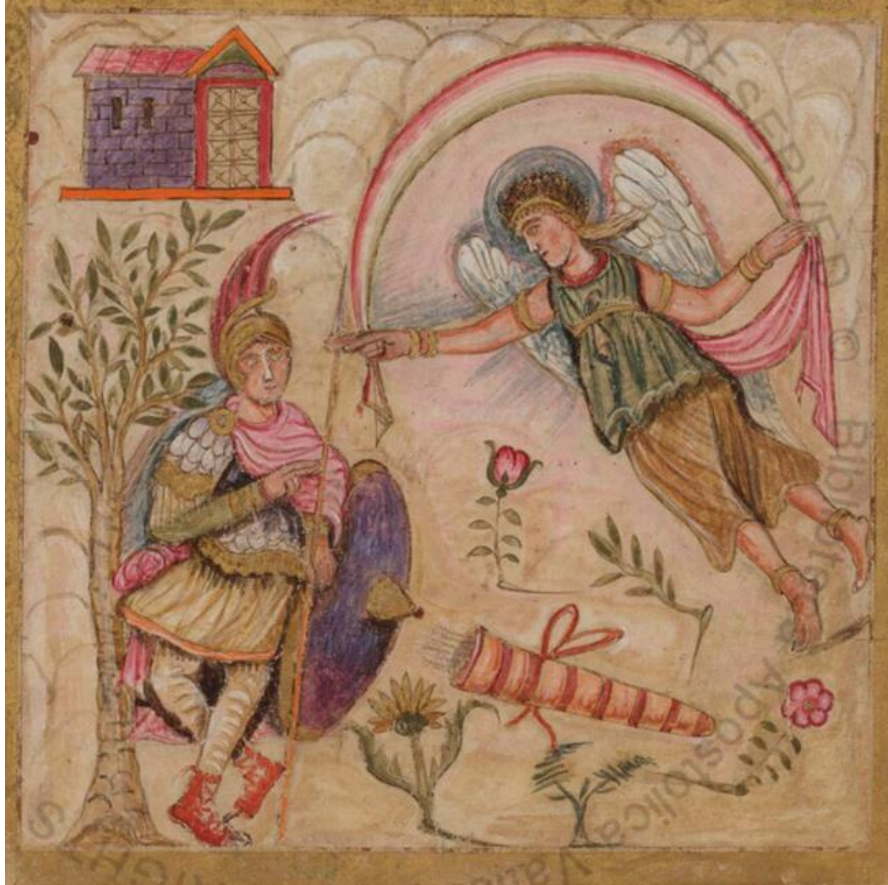
1. ábra. Kéziratos Codex Vergilius romanus illusztrációja Áriusról (Biblioteca Apostolica Vaticana, Vatikán)

Az ősi műveltség szakralitása sok esetben eretnek, üldözendő áltudománnyá lett minősítve, amivel az ókereszténység alól valójában kihúzták a talajt. A népművészet leszólt barbár szokássá vált. Bár kezdetben a cél még gyakorlatias szempontoktól vezetve (nem értvén az Athéni Iskolák tanítását) a Szentírást közérthetőbb formába öntése lehetett (Vulgata létrehozása), azonban egy új keresztény kultúra alapjainak lerakásával az ősi szakrális (ún. megszentelt, azaz égi eredetű) műveltség jelentősen torzult. Ugyanis a világi hatalmat kiszolgáló papság tudományos jellegű ismeretei messze elmaradtak a szkíták tudásától. Gondoljunk csak a Föld laposságának hirdetésére!