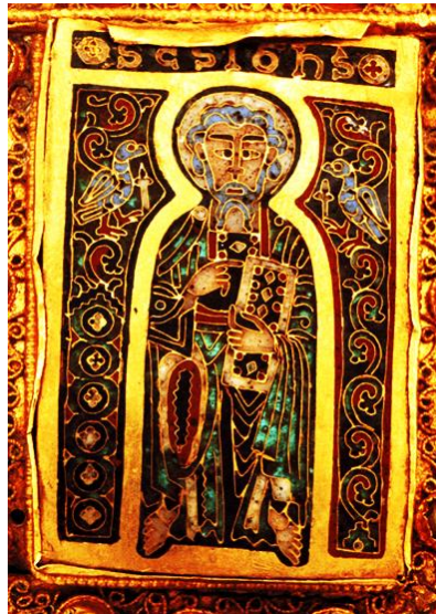
6. ábra. Szent János ikonja a koronán

Szent János ikonja alatt Szent Bertalan eltakarva, ami jól kifejezi a Halakkal szembenálló Szűz állatövi jegy lényegét. Az értelem munkája nem látható a felszínen, sok olyan aprólékos munkavégzésre van szükség, ami tulajdonképpen szinte senkit se érdekel, de enélkül nincsen eredmény. Vagyis a Szent János által átmentett kissé homályos információkkal az értelemnek a háttérben még dolgoznia kell annak érdekében, hogy a probléma megoldódjon, a megvilágosodás megtörténhessen.