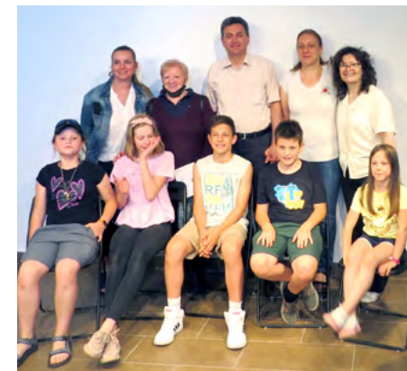
Délutáni versenyek és programok nyertesei

Kiváltságosnak érezzük magunkat, hogy felkérésünket elfogadta Mikó István színművész. Bármit játszik, énekel vagy verset mond, embersége megérint, szívünkbe költözik, Őt csak szeretni lehet. Mesés hangjai, szerelmes vallomása a csikóbőrös