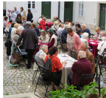
Kedélyes beszélgetés és finom falatok

népszerű szinkron-színész, tiszteletbeli Örmény. – a szerk./ Jókedvre derített válogatott vegyes műfajú előadásával. S Te ismét megleptél a cigány temperamentummal és minden mással.”