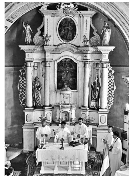
Ünnepi mise a római katolikus templomban

szorítására került sor, majd a résztvevők népes csoportja a helybeli római katolikus templomban hallgatta meg a Lászlóffy Árpád orgonaművész koncertjét. Ezután a közös ebéd következett, ahol felelevenítették a régi emlékeket és kapcsolatokat. Az érdeklődők megtekinthették a közel-múltban felújított örmény gyűjteményes