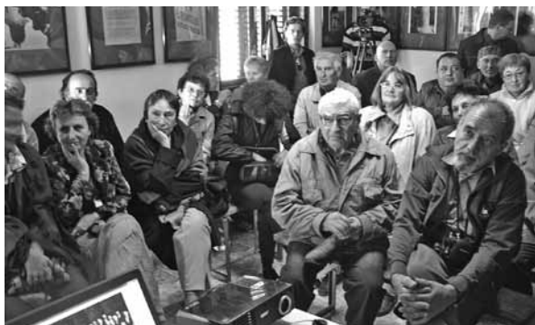
A közösségi ház közönsége