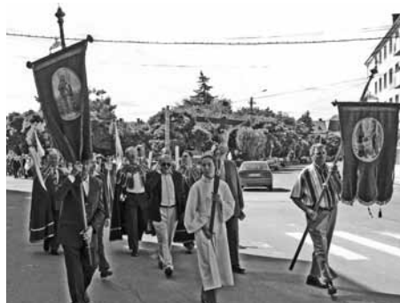
Körmenet Gyergyószentmiklós főtere körül