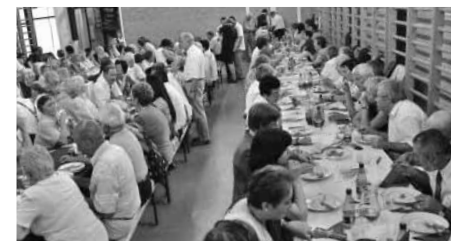
A családi találkozó résztvevői

(www.pluszportal.ro., 2011. szeptember 1.)