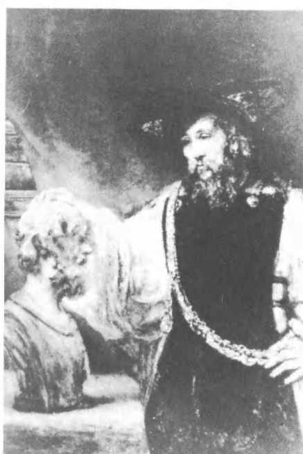
Rembrandt: Arisztotelész Homérosz szobrával