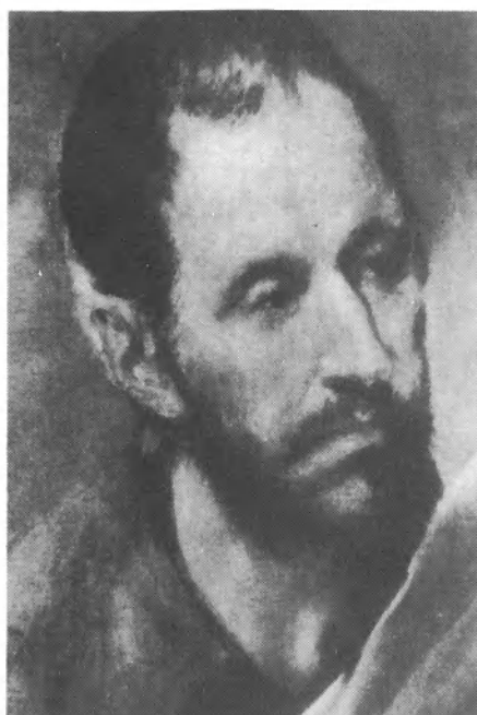
El Greco: Önarckép