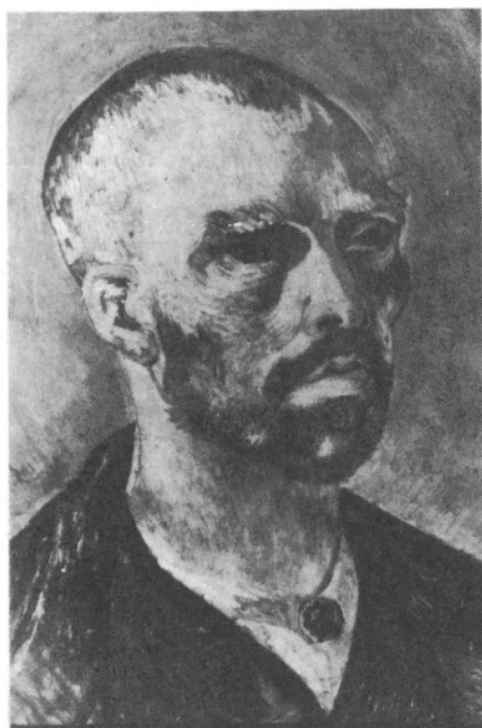
Van Gogh: Önarckép

A vakok és gyengénlátók egészségvédelméről szeretnék néhány történelmi adattal szolgálni, a múlt hagyományain építve jövőt, születésnapjaink virágcsokorként.