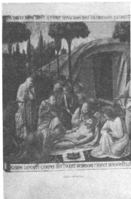
Fra Angelico: Jézus siratása

A húsvét a kereszténységnek is az egyik legnagyobb ünnepe, amelyen Jézus Krisztus mitikus feltámadását ülik meg. Húsvétban a zsidó pászach (pászka) és a pogány meghaló ás feltámadó istenek ünnepeinek vonásai keverednek. A keresztények a II. század elejétől hozták kapcsolatba a zsidók húsvétját Krisztus halálával és feltámadásával, mint ezen mitikus-legendás események évfordulójával. Húsvét megünneplésének napja kezdetben nem volt egységes. Általában az volt a szokás, hogy a feltámadás napját Nizán hónap 14-e utáni vasárnap tartották, előtte való pénteken pedig Krisztus halálára emlé-