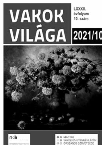
Vakok világa - 2021. 10. szám

Jó ütemben halad az MVGYOSZ székházának átépítése és felújítása Ajándékozzon vásárlási utalványt Töb