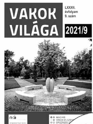
Vakok világa - 2021. 09. szám

Fehérbot napja_fókuszban a hangoskönyvek Családok az idői: Dolly születésnapja