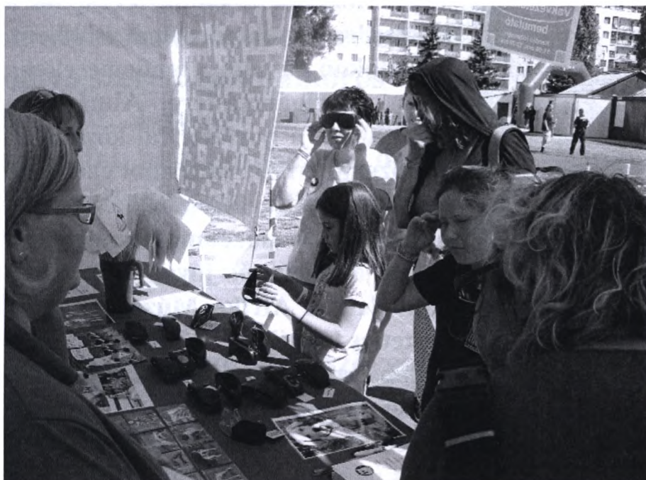
Szimulációs szemüveget próbálnak az érdeklődők

Az MGVYOSZ első Mosoly-vár élmény programját 2013. szeptember 7-én valósította meg a budapesti dr. Koltai Jenő Sportcentrumban, a Magyar Telekom, Telekom Olimpia elnevezésű rendezvényén.