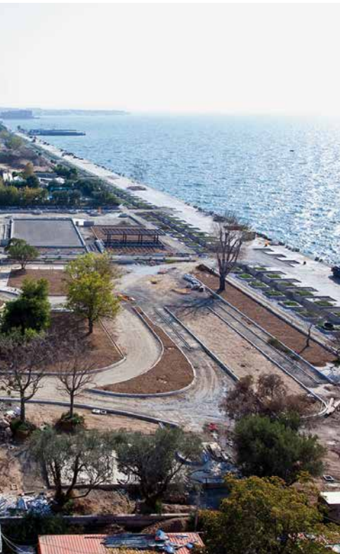
▶ Görögország második legnagyobb városa, Thessaloniki tengerpartjának rehabilitációja.