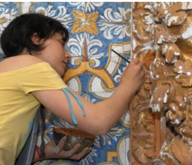
Egy román stílusú freskó restaurálása a portugáliai Sousa-völgyben

Ezt a három elemet erősítették meg a Bizottság által 2006. május 3-án elfogadott Zöld könyvben (2) . Ezen dokumentum központi témája az európai kommunikációs politika menetrendjét meghatározó látásmódok és javaslatok keresése. Ez a megközelítés megfelel a Bizottság által 2005. október 13-án elindított „D-terv a demokrácia, párbeszéd és vita érdekében” kezdeményezés mögött megbúvó gondolatnak, mely a polgároknak az Európára vonatkozó vitákban való aktív részvételét szeretné ösztönözni. A D-terv annak a hosszú távú folyamatnak az első szakasza, mely az Európai Unió demokratikus alapjainak a megszilárdítását és az uniós polgárok alapértékei és elvárásai közé történő beépítését tűzte ki céljául.