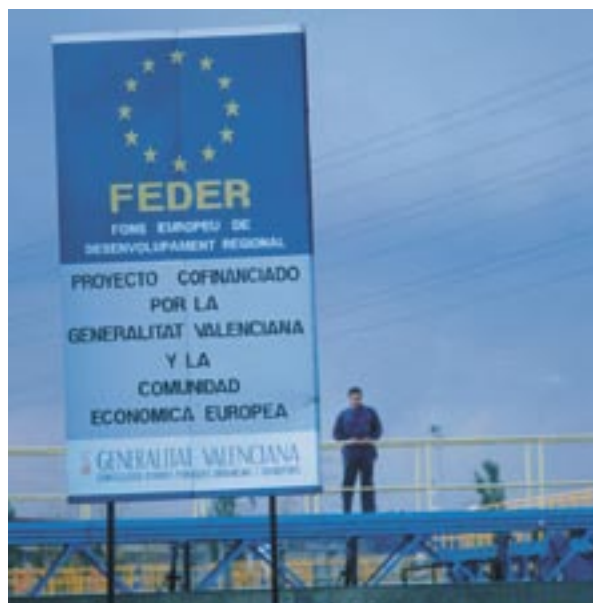
Az EU-támogatás promóciója Spanyolországban

a pénzügyi támogatás elfogadásával együtt azt is elfogadják, hogy felvegyék őket a kedvezményezettek listájára. Ezeket a a projektek neveit és az egyes műveleteknek nyújtott állami finanszírozás mértékét is feltüntető listákat az említett szabályzat 7.2(d) cikkének megfelelően fogják közzétenni.