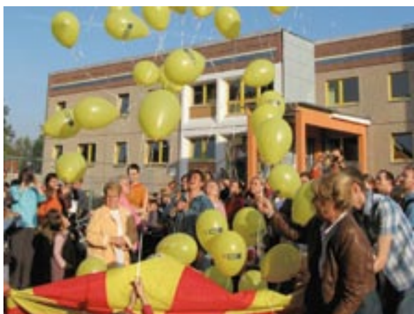
Egy bölcsőde megnyitása a lipcei URBAN II területen, Németországban