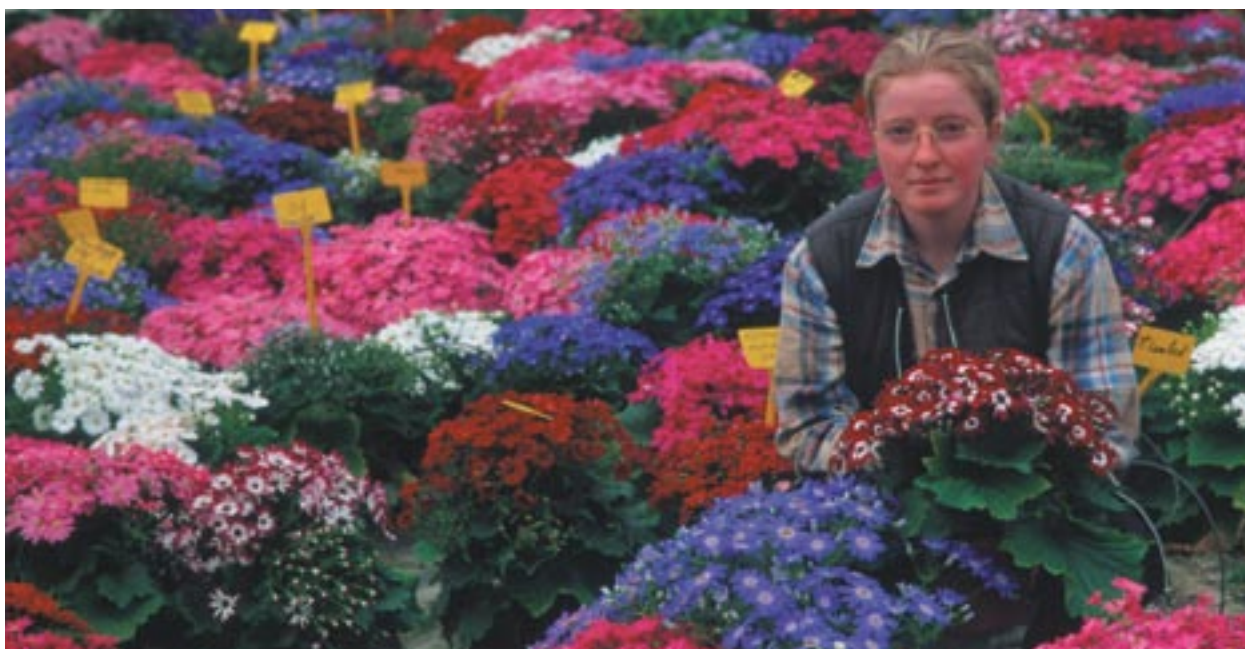
Az EREA által társfinanszírozott kertészeti kutatás és fejlesztés Barfleur-ben, Franciaország alsó-normandiai régiójában

Ki fog hasznot húzni a közösségi alapokból? Hogyan tájékozódhat a nagyközönség a strukturális alapok által finanszírozott projektekről? Milyen intézkedéseket javasolt a Bizottság az európai polgárok megkérdezésének és szerepvállalásának elősegítése érdekében? Milyen szerepet tölt be a Regionális Politikai Főigazgatóság ebben a hosszú távú folyamatban?