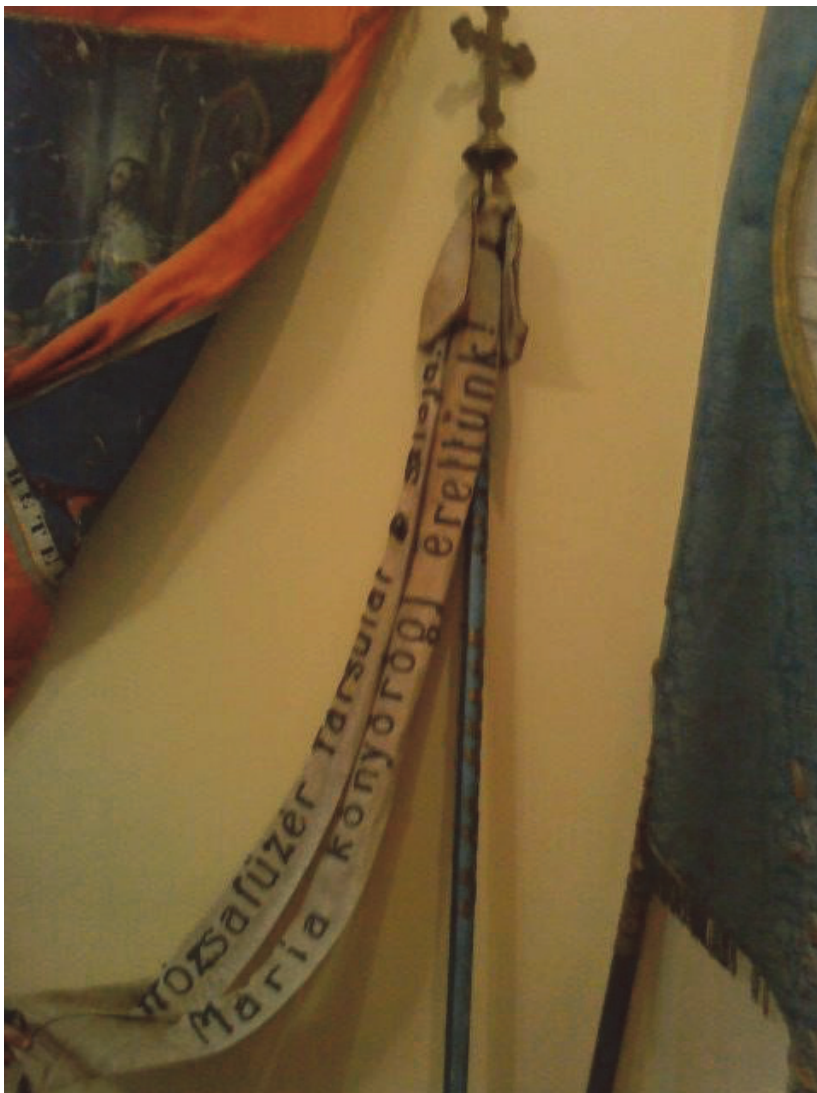
A RÓZSAFÜZÉR TÁRSULAT ZÁSZLÓJA (a beregszászi római katolikus plébánia kiállítóterme)

Szövetséggel. Ezen együttműködések nagyon harmonikusnak bizonyultak, mivel tevékenységük kiegészítette egymást. Ez a nagyobb rendezvények alkalmával volt leginkább tetten érhető, mivel az ifjúsági egyleti tagokat mindig bevonták a bállok, tánchos esték és kulturális programok szervezésébe.