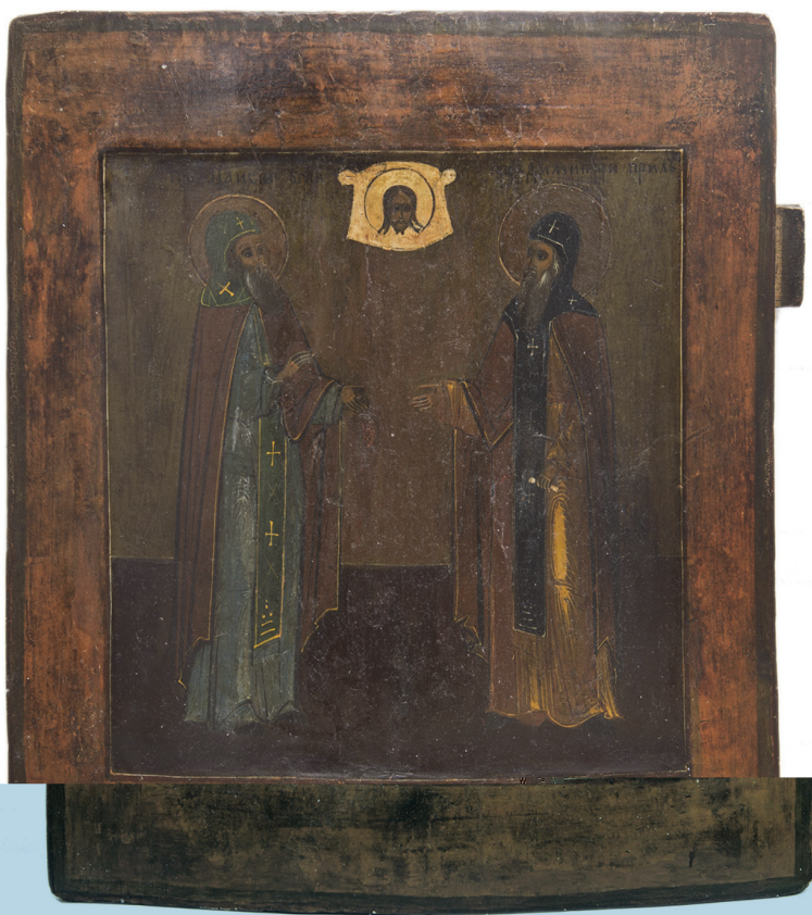
UGLICSI SZENT PAISZJ ÉS PRILUCKI SZENT GYIMITRIJ (Fent Akheiropoietosz) Orosz ikon, 1800 körül. Fa, tempera, olaj, 31,5 × 27,5 cm (magántulajdon, Budapest)