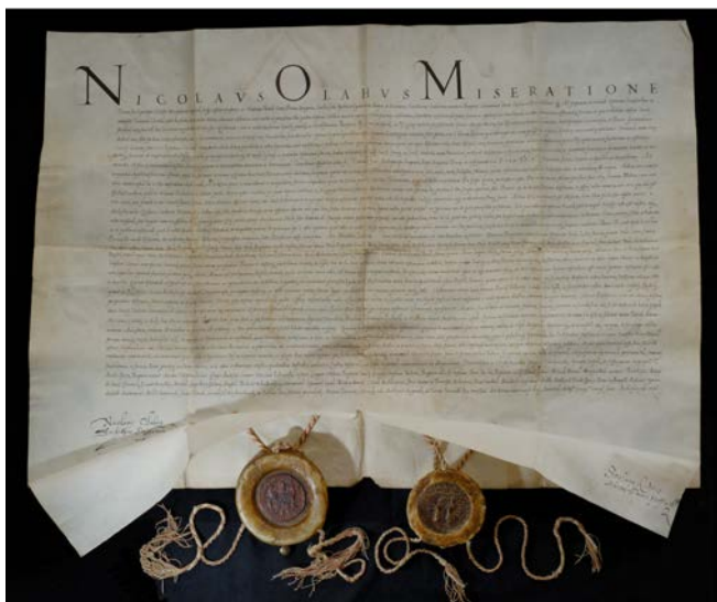
A NAGYSZOMBATI SZEMINÁRIUM ALAPÍTÓLEVELE, 1566. május 19.

Oláh Miklós komolyan vette a Trienti Zsinat határozatát, miszerint minden püspöknek szemináriumot kell alapítania egyházmegyéjében. Röviddel érseki hivatalának elfoglalása után, már 1554. január 1-jén tanácskozott a városi magisztrátussal és a káptalannal. Áttekintette az új városi iskola alapszabályait, ami bizonyítja, milyen fontosnak tartotta a fiatalok felkészítését. Ugyanakkor a rendkívül bonyolult helyzet miatt több mint 12 évig tartott, amikor megérett az idő a papi szeminárium alapítására 1566. május 19-én. 8