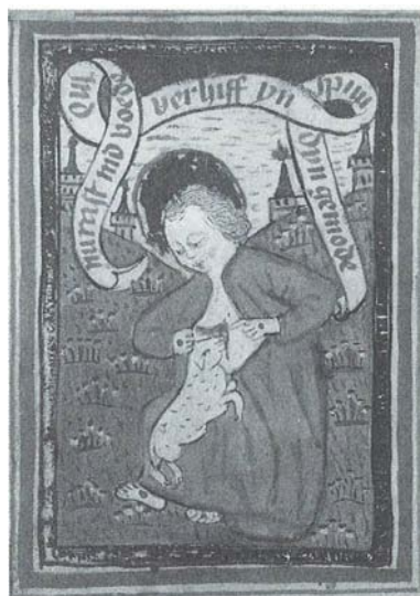
A KÖLNI IMAKÖNYV ILLUSZTRÁCIÓJA

A motívum nem teljesen ismeretlen: a népi ájtatosságot, vallásosságot célzó szentképecskéken és imakönyvekben is előfordul a XVIII–XIX. században. Ám (legkésőbb) már a XV. században ismerős volt, amint ezt az egykori kölni karthauzi rendház egyik illuminált, kéziratban ránk maradt imakönyvének illusztrációja is mutatja. 21