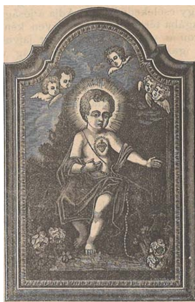
AZ ERZSÉBETVÁROSI JÉZUS SZÍVE-KÉP