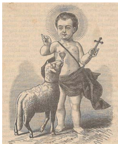
A SZÉKELYUDVARHELYI KÉP