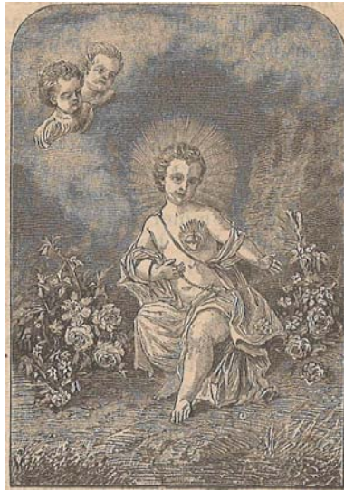
AZ EGRÍ JÉZUS SZÍVE-KÉP