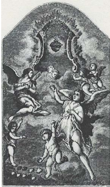
AZ EPERJESI JÉZUS SZÍVE-KÉP