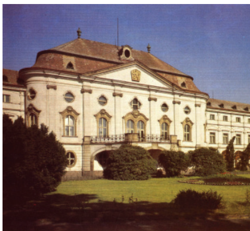
PRÍMÁSI NYÁRI PALOTA POZSONYBAN (közli: HOLČÍK)