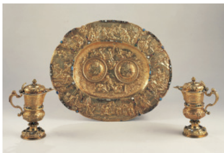
KÁROLY AMBRUS MISETÁLCÁJA ÉS MISEKANNÁI Johan Jakob Vogelmund, Augsburg 1717. Esztergomi Főszékesegyházi Kincstár

A Károly Ambrus hagyatékából származó tárgyak, amelyek az esztergomi kincstárban találhatóak, feltételezhetően szerepeltek a királyné koronázásakor: kehely és misekannák tálcával, bécsi rokokó úrmutató, XVIII. századi