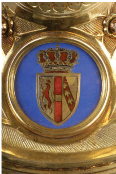
KÁROLY AMBRUS KELYHÉN LÉVŐ CÍMERE