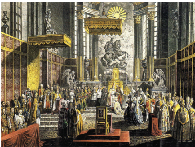
MÁRIA LUDOVIKA KIRÁLYNÉVÁ KORONÁZÁSA A POZSONYI DÓMBAN Színes rézmetszet, 1808

Ekkor a nádor levette a király koronáját a párnáról és átadta a szentelő primásnak, aki a nádor segítségével a királyné jobb vállához érintette, jelképezve ezzel, hogy férjével együtt viselik a kormányzás terhét. A Szent Koronát ezután a király fejére tették. Miután a primás jobbába adta a jogart és baljába az országalmát, 63 a királyné az udvari prefektus és az asszisztáló püspökök kíséretében harsona- és dobszó közepette a főoltártól trónusához vonult. Főherceg testvére, a primás bemutatta őt. Ekkor mindenki felállt, és teli torokkal háromszor vivatot kiáltott. A primás intonálta a Te Deumot , majd ismét megszólaltak a harangok, és üdvözlő ágyúlövés hallatszott. A himnusz után a primás visszament az oltárhoz, az asszisztáló veszprémi püspök 64 pedig levette a királyné házi koronáját, és átadta a prefektusnak, a jelvényeket a párnára helyezte. A mise az Evangéliummal folytatódott, amelynek végén a diakónus, az egri érsek és a veszprémi püspök megjelölte a könyvet, azután a királynak, majd a királynénak nyújtották csókra, és mindkettőjüket megtömjéneztek. Felajánláskor a veszprémi püspök újra a királyné fejére tette a házi koronát és az oltárhoz vezette, aki egy aranypénzt ajánlott fel aranypatenán, amelyet a szertartónak nyújtott. A szentelő megcsókolta a patenát, a királyné pedig visszatért a trónushoz. A prefációhoz a veszprémi