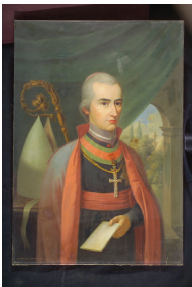
KÁROLY AMBRUS PORTRÉJA