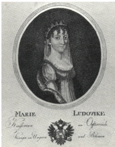
MÁRIA LUDOVIKA PORTRÉJA

Antal Károlynak, 12 Lombardia kormányzójának és az Estei ágból származó Mária Beatricének, 13 Modena örökösének a házasságából született. Ferdinánd testvére I. Ferenc császár volt, vagyis Ludovika és Károly Ambrus a császár unokatestvérei voltak. A család némely forrás szerint 9 gyermeket számlált: Mária Terézia (1773. nov. 1.), 14 József Ferenc (1775), 15 Mária Leopoldina (1776. dec. 10.), 16 Ferenc (1779. okt. 6.), 17 Ferdinánd Károly (1781. ápr. 25.), 18 Miksa József (1782. júl. 14.), 19 Mária Antónia, 20 Károly Ambrus (1785. máj. 2.), 21 Mária Ludovika (1787. dec. 14.). 22 A Habsburg Lexikon ban nem szerepel sem József Ferenc, sem Mária Antónia, ebben az esetben 7 testvérrel kell számolnunk.