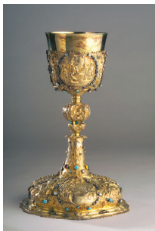
KÁROLY AMBRUS KELYHE Johan Jakob Vogelmund, Augsburg 1717. Esztergomi Főszékesegyházi Kincstár