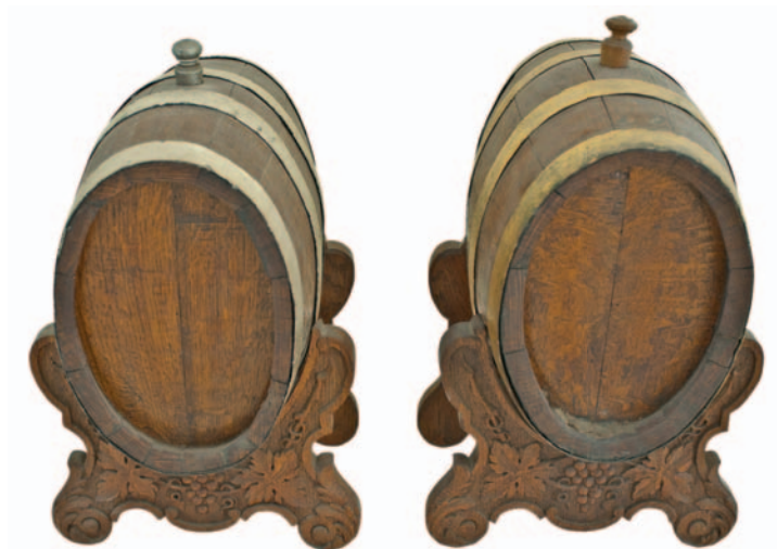
9. KÉP. CZAPIK GYULA, 1946 ELŐTTI HORDÓCSKÁK FENEKE ÜRESEN.

Ezeken felül az egri érseki gyűjteményben található még két hordócska, amelyeken Czapik Gyula püspöki címere látható (8. kép). A hátlapja teljesen üres (9. kép), viszont igen díszesek a hordócska tartói, ezért bátorodom feltételezni, hogy ott, talán szentelő főpapként, Serédi Jusztinián címere lehetett. Ezeken, a kék pajzsmező talpán vörös asztalon fekszik a Szentírás, rajta vörös