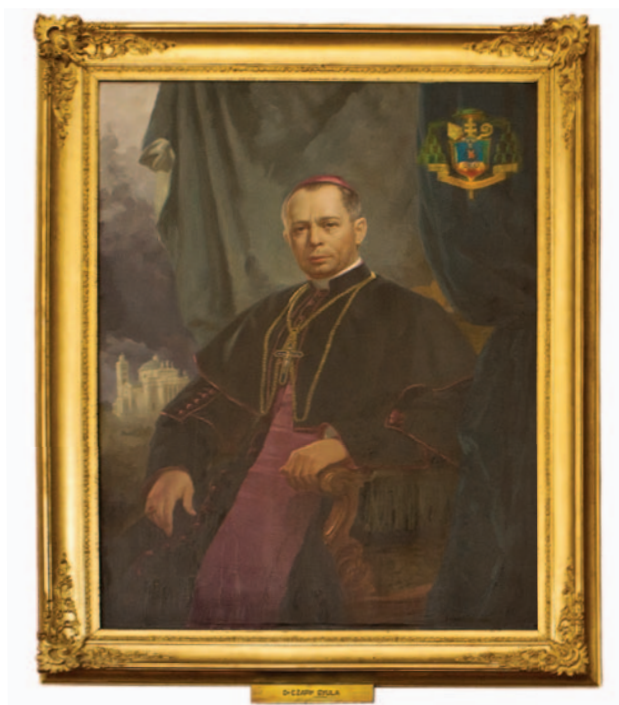
1. KÉP. CZAPIK GYULA PORTRÉJA A CÍMERREL. Egri érsekség.

Endrey Mihályt 1950. november 20-án nevezték ki baratai címre püspökké és egri segédpüspökké. Szentelése 1951. április 1-jén történt. Miért éppen Czapik Gyula szentelte püspökké? A szentelést általában az illetékes egyházmegye pátriárkája, érseke szokta végezni, bár megjegyezték, hogy Serédi Jusztinián primásként szívesen szentelt püspököket. Mindszenty József azonban 1951-ben már nem végezhetett szentelést érseki székének akadályoztatása miatt. Ebben az esetben a püspök érsekére hárult a szentelés feladata. Czapik Gyula ekkor egri érsek volt, Endrey Mihály pedig címzetes püspökként egri segédpüspök lett.