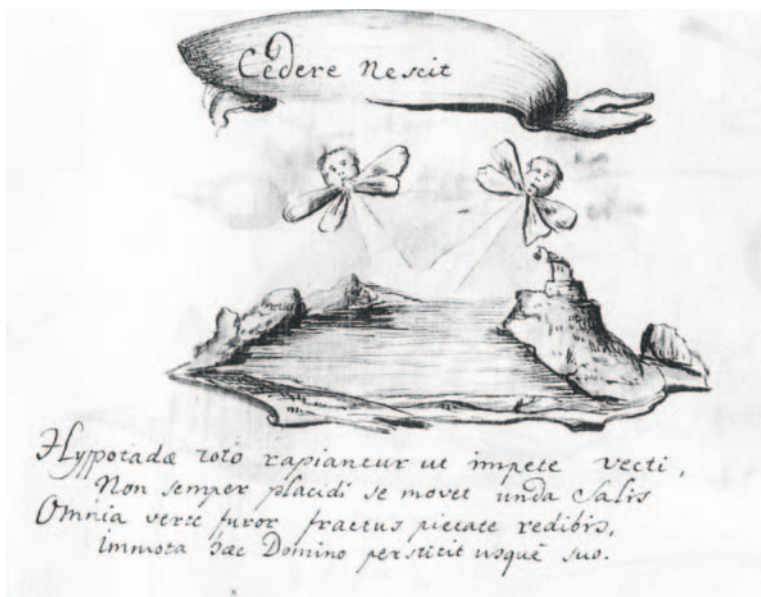
A RÉVAY ANTAL PÜSPÖK HÁZÁNAK FALÁRA KIHELYEZETT EMBLÉMA VÁZLATA 57

Magára az érseki beiktatásra másnap, július 2-án, Sarlós Boldogasszony ünnepe- pén került sor. 58 Reggel kilenc órakor Migazzi bíboros viszontlátogatást tett Batthyánynál, majd a káptalani kereszt alatt együtt indultak el a primási rezi- denciáról a Szent Miklós-székesegyházba harangzúgás és a templomból kihal- latszó orgonaszó közepette. Kíséretüket a nemesek és főnemesek, a káptalan és a klérus tagjai adták. Miután beléptek a templomba, a bíboros és a primás a