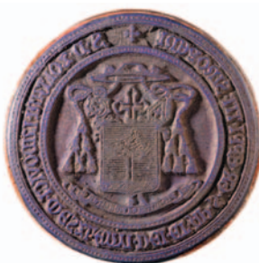
KÁPTALANI VIKÁRIUSI TIPÁRIUM GUMIBÓL (PL Pecsétgyűjtemény. Nr. 137. Ø 38 mm).

A püspök boldoggá avatási életrajzának megírásakor merült fel a gondolat, hogy meg lehetne festeni a püspöki címet. A címer színezésében a tipáriumok grafikus jelzései segítséget jelentettek. A páztorbot a heraldikai jobb vagy bal oldalra kerülésében az számított döntőnek, hogy a püspökszentelés szer- tartási könyvén nem pecsétnyomóként olvasható a címer, hiszen az alatta lévő jelmondat pozitíven jelenik meg. Így került a püspöksüveg a heraldikai jobb oldalra.