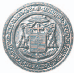
KÁPTALANI VIKÁRIUSI TIPÁRIUM ÓLOMBŐL (PL Pecsétgyűjtemény. sine numero).