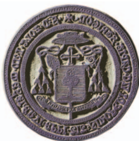
KÁPTALANI VIKÁRIUSI TIPÁRIUM GUMIBÓL (PL Pecsétgyűjtemény. Nr. 138. Ø 38 mm).