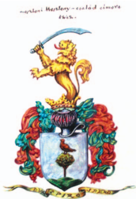
MESZLÉNYI-CÍMER, 1242 (Beke 2009, 310)

A családi címer régebbi ismert formája figyelhető meg a Sallér-életfán. Festetics György felesége, Sallér Judit oklevelében, amelyet I. Ferenc 1793.