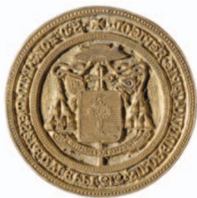
KÁPTALANI VIKÁRIUSI TIPÁRIUM RÉZBŐL (PL Pecsétgyűjtemény. Nr. 135. Ø 38 mm).