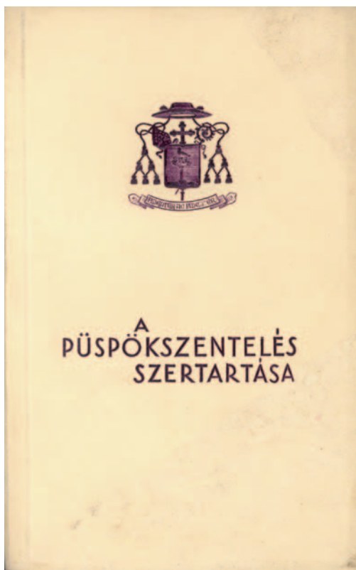
PÜSPÖKKÉ SZENTELÉSI ORDO (Beke 2009, 332).

kiválasztottnak lelkét ... és az anyaszentegyházat, amelyben az apostoloknak új utóda támadt. ... Kísérje őt az Isten áldása munkájában, amelyet mindig annyi hűséggel végzett el. 'Fidenter ac fideliter' 4 haladjon, küzdjön, vigye az élet keresztjét 'ad multos annos' 5 6 – írja a cikk szerzője, LL. 7 A gyönyörű napsütéses őszi reggelbe fél kilenckor belekondult a bazilika nagyharangja, jelezve, hogy nagy ünnep készül a magyar Sion hegyén. Ezután valóságos búcsújárás indult meg a szenthegy felé, autók, kocsik,