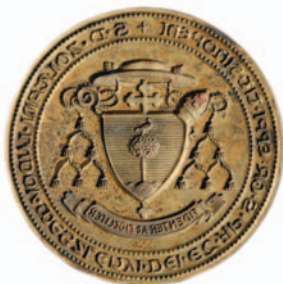
PÜSPÖKI CSÜCSKOS TALPÚ TIPÁRIUM SÁRGARÉZBŐL (PL Pecsétgyűjtemény. Nr. 136. Ø 30 mm).