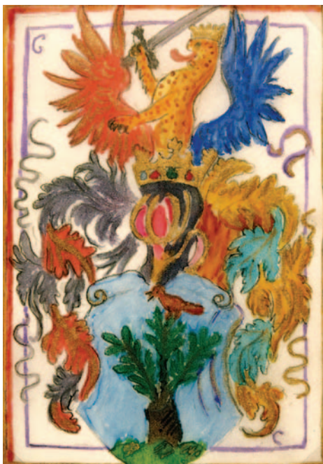
MESZLÉNYI IGNÁC CSALÁDI CÍMERE (Fejér Megyei Levéltár. F IV. A 72. Fejér vármegye nemességi iratai. B. Nemességi iratok. 572. t.)

arany-kék, a heraldikai bal oldalon vörös-ezüst változatú. A sisakdísz itt is az oroszlán.