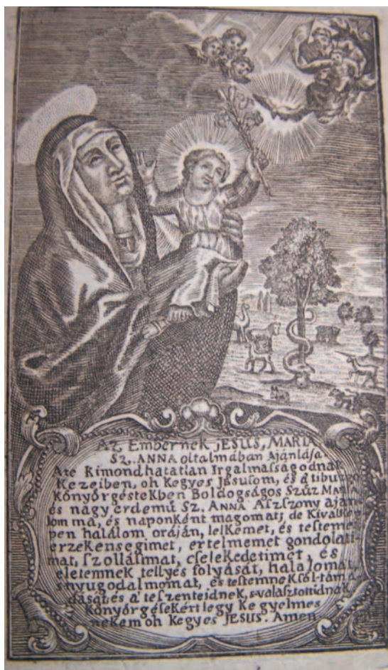
A NAGYSZOMBATI SZENT ANNA-KONGREGÁCIÓ 1746-OS FELVÉTELI LAPJA, címlap