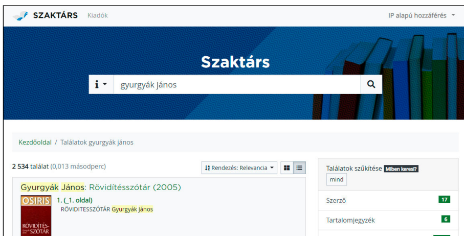
3. ábra A Szaktárs adatbázis keresőfelülete használat közben

A Szaktárs adatbázis technológiai háttérét tekintve az Arcanum Kft. fejlesztése. Egy olyan szolgáltatást kínál szakkönyvkiadóknak, amely segítségével korszerű felületen, elektronikus formában jeleníthetik meg kiadványaikat. Az előfizetés során az intézmények dönthetnek arról, hogy melyik kiadó könyveihez szeretnének hozzáférést kapni. Minden csatlakozott könyves cégnek van külön oldala, saját aldomainnel és egyedi kezdőlappal. A keresés és a megtekintés módja mind-egyiknél egységes, az Arcanum műszaki megoldása működött, így az ADT-nél és a Hungaricana adatbázisnál már megszokott használati móddal találkozhatunk.