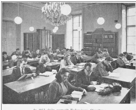
Az 1953 elején megújult Tudományos Olvasóterem