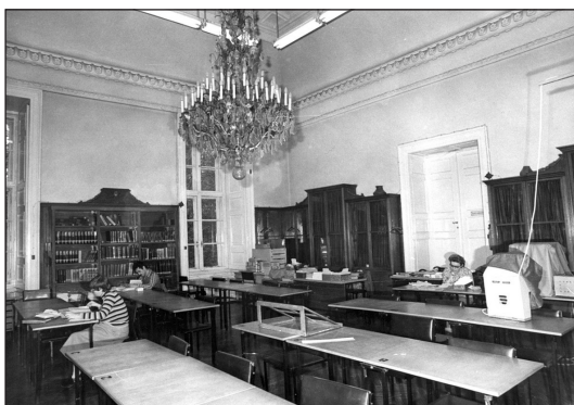
Tudományos olvasóterem (1983)