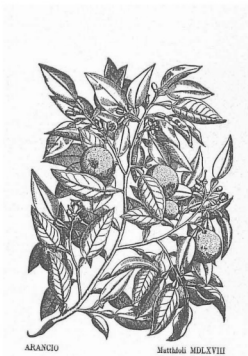
In: Rivista della Ortofrutticoltura Italiana. 1909. vol. 58.

Entz Ferenc Könyvtár és Levéltár 1118 Budapest, Szűret utca 2-18. Tel.: 482-6587 http://efkl.uni-corvinus.hu/