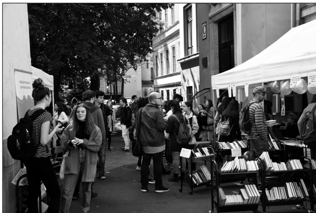
Könyvtári Nap a Trefort-kertben

onnantól kezdve már igényt tartott rá, és a szervezők korábban tapasztalt technikai nehézségek is megszűntek. Ettől fogva beszélhetünk az állandó helyszín legnagyobb előnyének érvényesüléséről, az állandóságról, beleértve a kitelepülés technikai, informatikai háttérének biztosítását és az egyre hatékonyabb kommunikációt. Ugyanis az elsőéves hallgatók már az első tájékoztató előadásokon értesülnek a Trefort-kerti Könyvtári Napról, továbbá a kari és a tanszéki digitális hirdetőfelületekre is automatikusan kihelyezésre kerülnek a rendezvény hirdetései.