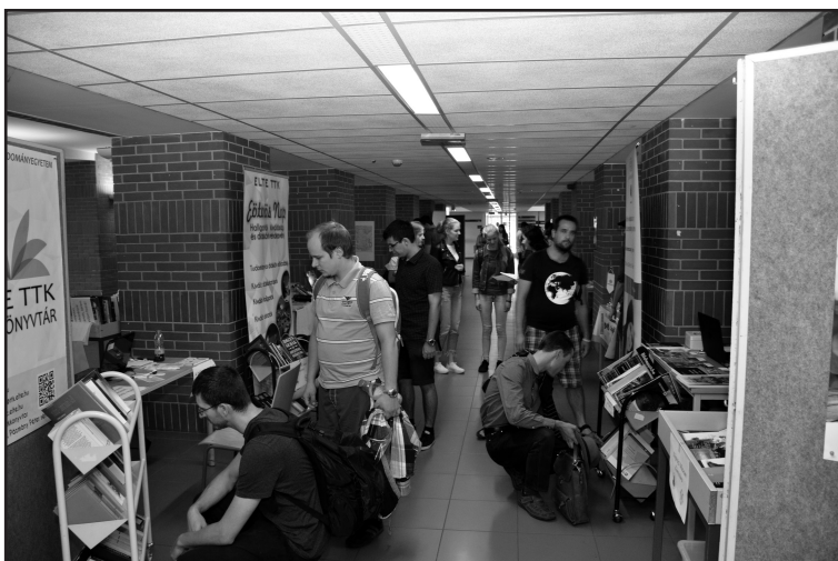
Könyvtári Nap az ELTE Lágymányosi épületében – 2017

A tanulságok értékelése okán a következő évben visszatértünk az egyrendezvényes menetrendhez. 2019-ben viszont újra két alkalommal, két helyszínen szerveztük meg a kiállítást, ezúttal Lágymányoson is külső helyszínt választva, így ott is közel háromszázötven résztvevőt tudtunk elérni.