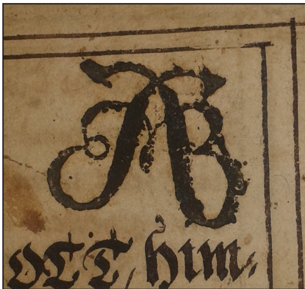
A könyvtár pecsétje

Itt szeretnék egy rövid megjegyzést tenni az „égett bibliával” kapcsolatban. Az Evangélikus Életben megjelent könyvtártörténeti összefoglalót a Magyarországi Evangélikus Egyház megosztotta a Facebookon. A nyitóoldalán az égett biblia fotója volt látható. Ez azonnal kapott egy negatív hozzászólást, mely szerint: „Nem jó hírverés egy rongyos, ázott, penészes, égett Szentírással hírverést csinálni egy keresztyén könyvtárnak.”, továbbá: „Az evangélikus értékeinket érdemes ügyesebben ismertebbé tenni, kérjenek szakértő segítséget az Országos Egyházon belül.” Nehéz egy ilyen kommente higgadtan válaszolni, érdemes egyet aludni rá. A kommentelő valószínűleg a cikket csak felületesen olvasta el, hiszen minden könyvtár vagy egyház büszke lehet egy olyan kötetre, amit a templomszolga élete kockáztatásával ment meg, még ha égetten is. Ez a könyvmentés nagyon szép példája annak, hogy eleink számára mennyire fontos volt Isten ígéje. Téves az a megállapítás is, hogy könyvtárunknak akár egyetlen kötete is penészes lenne. A cikk feltöltése a közösségi oldalra a könyvtár népszerűsítését, ismertségét igyekezett szolgálni, ugyanakkor ez az eset arra is jó példa, hogy ez mennyire eltérhet a posztoló szándéktól.