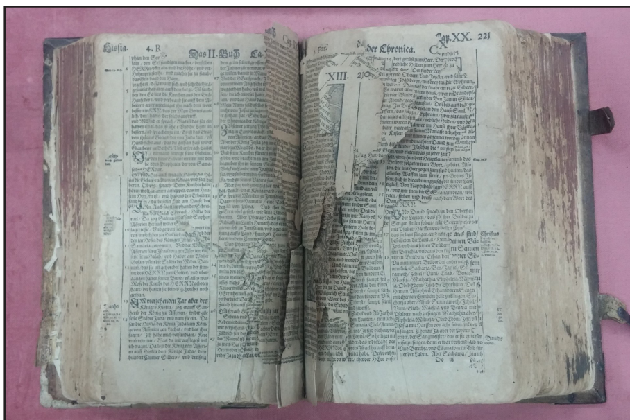
A megégett, de megmenekített biblia