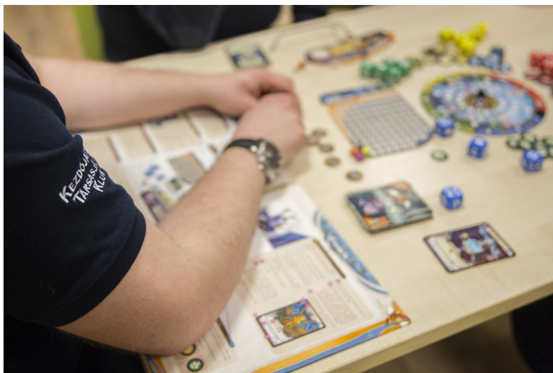
Kezdőjátékos Társasjáték Klub

Nagy sikerű a Társasjáték Klub, ami 2017 októberében intézményünk kezdeményezésére indult. A vezetésére sikerült a megfelelő személyt megtalálnunk, aki barátait, ismerőseit mozgósította, de rajtuk kívül is folyamatosan csatlakoznak fiatalok, idősebbek. A Kezdőjátékos Társasjáték Klub Facebook csoportnak már több mint 80 tagja van. A gyermekkönyvtár épületében kaptak helyet, maximum 30 főt tudunk leültetni, így már elértük a felső határt. A tagok havonta kétszer találkoznak.