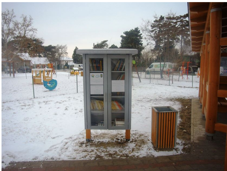
Kültéri szekrény

azt mutatják, hogy az érdeklődés hónapok óta töretlen. Már nem csak visznek, hanem tesznek is könyvet. Nagyobb mennyiségű könyvadományok továbbra is a könyvtárba érkeznek.