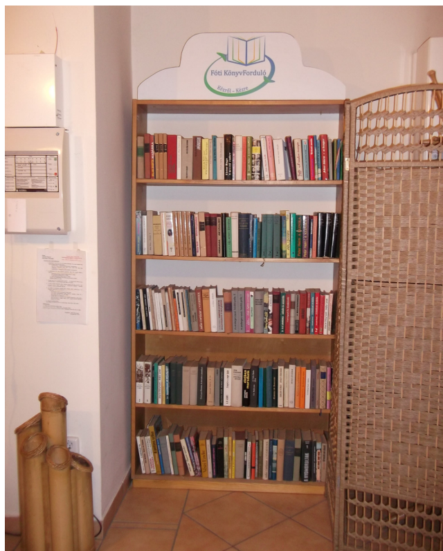
Kisalagi Fiókkönyvtár ingyen könyvek polca

A beltéri könyvszekrények megvalósításával kezdtük, hiszen ezek kivitelezése tűnt egyszerűbbnek és olcsóbbnak. Felhívást tettünk közzé mind a Fóti Hírnökben , mind a könyvtár és a Városszépítő Egyesület honlapján, valamint a Facebookon, hogy várjuk a lakossági felajánlásokat. Könyvtári hírlevelet küldtünk közel ezer címre az integrált könyvtári rendszeren keresztül. (A GDPR szigorítások óta ezt a kommunikációs csatornát már csak nagyon szűk körben használhatjuk, de 2018. május 25. előtt még nem lépett életbe a szigorított adatvédelmi rendelet.)