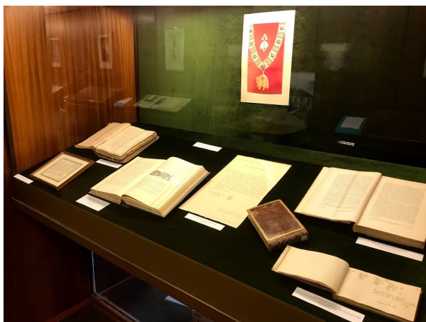
Kiállítás a Széchenyi családról