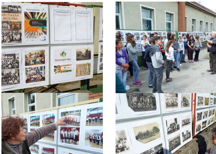
Időutazás a múltba – szabadtéri kiállítás

désekre, amelyek között ilyenek szerepeltek, pl.: Ki hozta létre községünkben a mozit 1939-ben? Milyen műemlék található Ráckeresztúr Martonvásár felőli határában?; Ki festette a ráckeresztúri templom falfestményeit?