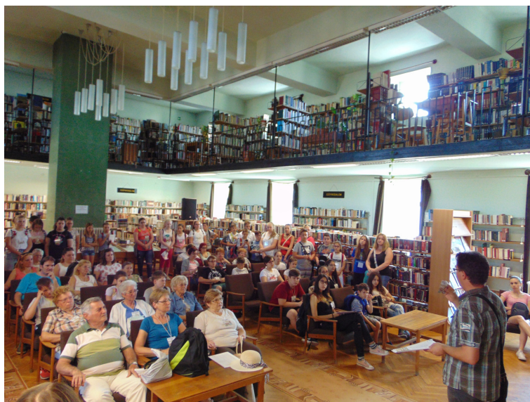
Indul a Zrínyi túra 2018-ban.

Folyamatosan keressük a lehetőséget, hogy a könyvtár és a Várbaráti Kör közös akciókban, projektekben vehessen részt. Ezért volt kiváló lehetőség 2018-ban Cselekvő közösségek – aktív közösségi szerepvállalás kiemelt projekt keretében a Zrínyiek nyomában című interaktív térségi vetélkedősorozat mintaprojekt létrehozása, melyet a Várbaráti Kör valósított meg a kulturális területen működő szervezetek összefogásával. Már a „Mintaprojektek megvalósítása” című felhívás megjelenésekor éreztük, hogy ez nekünk szól, tovább tudjuk fejleszteni, ki tudjuk bővíteni az együttműködést, a mintaprojekt segíteni fogja a könyvtár közösségi részvételi működésre irányuló tevékenységének erősítését is. A projekt megvalósításának gerincét a könyvtár és a Várbaráti Kör jelentette, ehhez csatlakozott a Zrínyi Miklós Közérdekű Muzeális Gyűjtemény a hagyományörzőivel, a Viga-dó Kulturális Központ és az azt működtető Szigetvári Kultúr- és Zöld Zóna Egyesület, a résztvevő oktatási intézmények, a könyvtári szolgáltató helyek, további egyesületek,