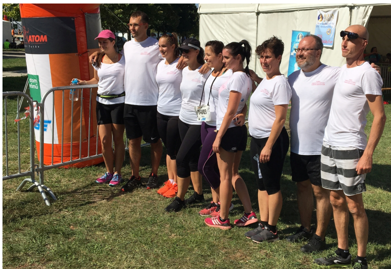
A könyvtár buliváltója az Atomfutáson

Érdekességként említem meg az Atomfutást. Több kolléga szeretett volna indulni a versenyen, ezért csapatunkba olvasókat toboroztunk a Facebookon keresztül. Meglepetésként ért minket, hogy milyen gyorsan lett meg a létszám a 10 fős buliváltóhoz. Nagyon jó élmény volt, a csapat tagjait azóta még szorosabb szálak fűzik a könyvtárhoz.