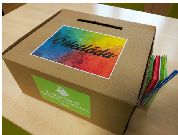
Ötletláda a gyermekkönyvtárban

Gyermek és felnőtt könyvtárunkban egyaránt ötletládákat helyeztünk el. A dobozba bármilyen jellegű véleményt, javaslatot várunk, akár dokumentumbeszerzésre vonatkozóan, akár a működési körülményeket illetően. (Pl. volt olyan olvasó, aki azt jelezte,