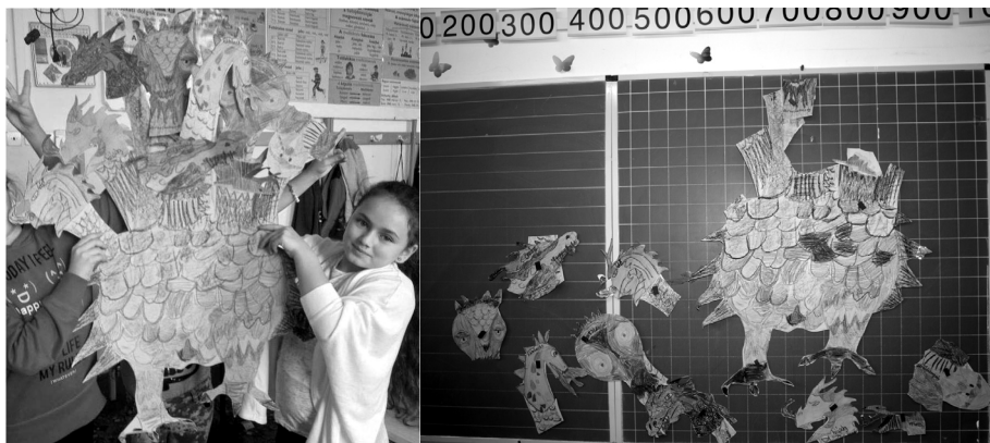
Elkészült a kilencefejű sárkány

A kilenc sárkányfej meséje indított el minket az úton. A Minden Ajtót Nyitó Varázskules című mese meghallgatása előtt kiosztottuk a meshallgató medálokat, amelyek látszatra csak egy sárkányfejet ábrázoltak. A medálok igazi szerepére csak a foglalkozás végén derült fény. Miután megismerkedtek a manó lány történetével, kibonthatták a sárkányfejes medálokat, amelyek a kilences számot rejtették. Mindannyian boldogan vették tudomásul, hogy a kilences szám lóg a nyakukban. Ezután beszélgettünk ennek a számnak a jelentőségéről, miszerint a számmisztikában a kilences a tökéletesség, a teljesség száma. Ahhoz, hogy ezt a teljességet elérjük, és boldogabb életet élhessünk, meg kell küzdenünk sok olyan emberi tulajdonsággal, amelyek akadályoznak minket ennek megélésében. A mesekönyv meséinek segítségével különböző próbatételek elé állítottuk a gyerekeket, amelyek