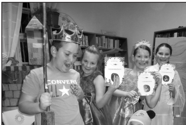
A vámosgyörki e'mese csapat Macskació előadása

A második próba teljes egészében a település könyvtárosa volt bízva. Ez a próba az alkotásról szólt. Egy – a gyerekek és a könyvtáros által együttesen választott – mese volt az alapja ennek az alkotó tevékenységnek. Ezzel kapcsolatban sem volt semmiféle kitételünk, elvárásunk. Abba az irányba próbáltuk mozdítani a gyerekeket segítő könyvtárost, hogy olyasmit csináljanak, amihez leginkább affinitást éreznek. Volt, aki színházi előadást csinált; voltak, akik rejtvényt, mások, kőlevelet, csuda-fát készítettek. Ez kapunyitás volt afelé, hogy minél szabadabban, bátrabban alkossanak, talán még a nem oly távoli jövőben is.