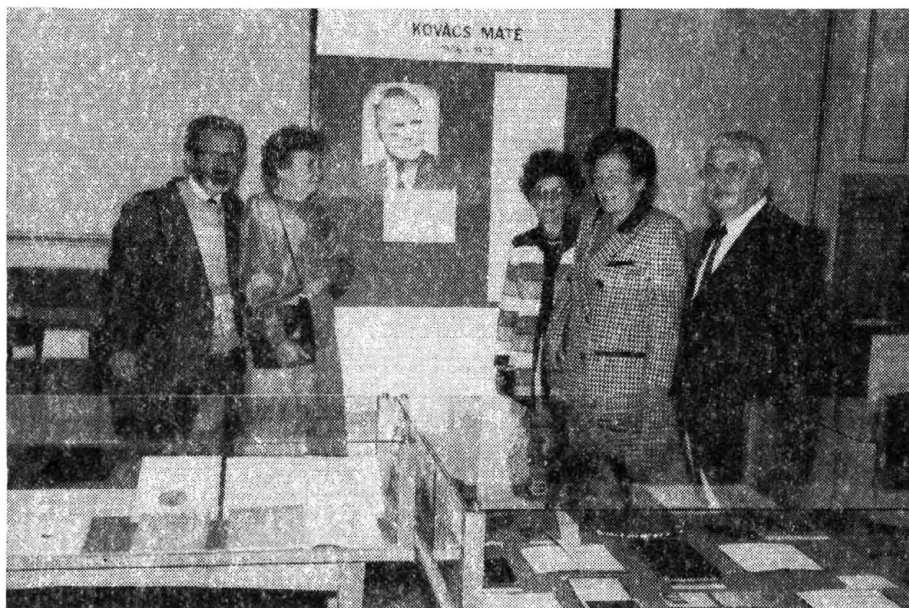
Évfolyamunk néhány tagja a könyvtárban rendezett kiállításon

Az idei, számunkra jelentős MKE Vándorgyűlést megelőzően, ahol „segéd-személyzetként” a szervezésben, lebonyolításban is részt vehettünk, vendégként voltunk jelen Győrben, Kőrmendén, Egerben. Mindez jó előtanulmányokat jelentett a mostani Kovács Máté Emléküléshez, melynek előkészítésében, megvalósításában is vállalunk feladatokat.