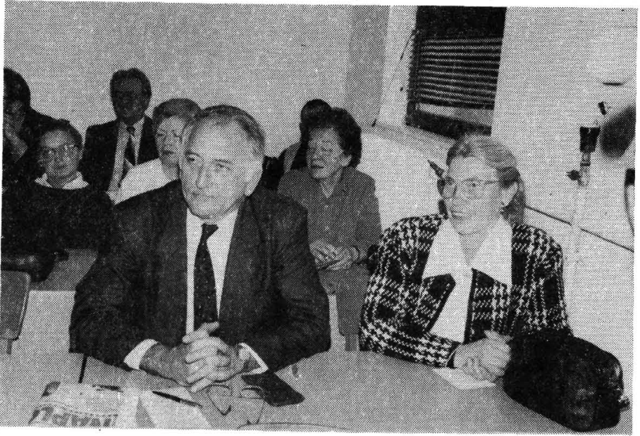
Az emlékező szekció közönsége