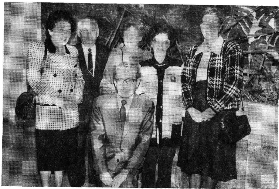
A nevezetes 1956–61-es évfolyam tagjai az ülészakon