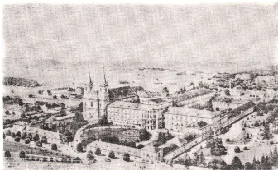
A zirci ciszterci kolostor látképe a XX. sz. elején, és ma