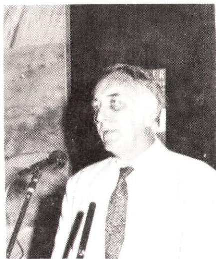
Poprády Géza, az OSZK főigazgatója