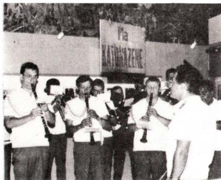
A vendégek egy csoportja