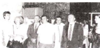
Szabó István filmrendező

Képek az OSZK „Ember az embertelenségben” c. kiállításának megnyitójáról. Híradásunkat lásd a 66. oldalon