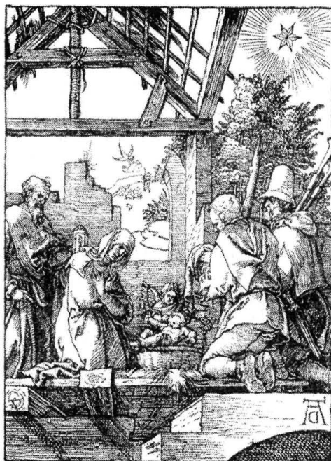
Albrecht Dürer: Jézus születése – famszét (1511)

Minden kedves olvasónknak, előfizetőknek, hirdetőnknek, kollégáknak kellemes karácsonyi ünnepeket és boldog új évet kívánunk