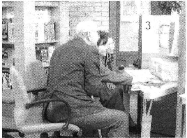
Utazás az interneten: a barangolást a könyvtáros segíti