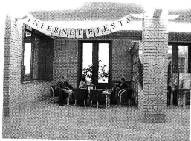
Az Infotéka is szeretettel látja a rendezvényre érkezőket