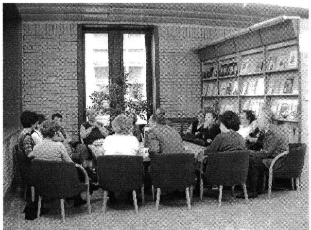
„Nagyik a Neten: Idősebbek is elkezdhetik” Beszélgetés az internetről, gondolatok, vélemények, kérdések, élménybeszámolók...