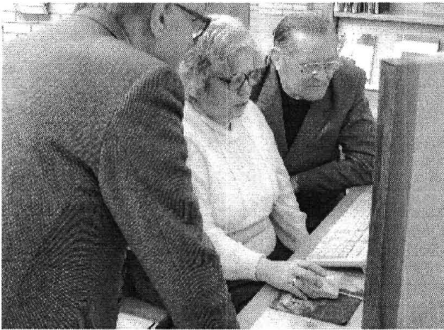
„Hogy is mondták...?”