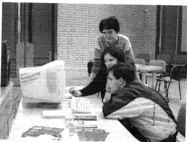
Ismerkedés az internettel, folyik a LinkQuiz játék