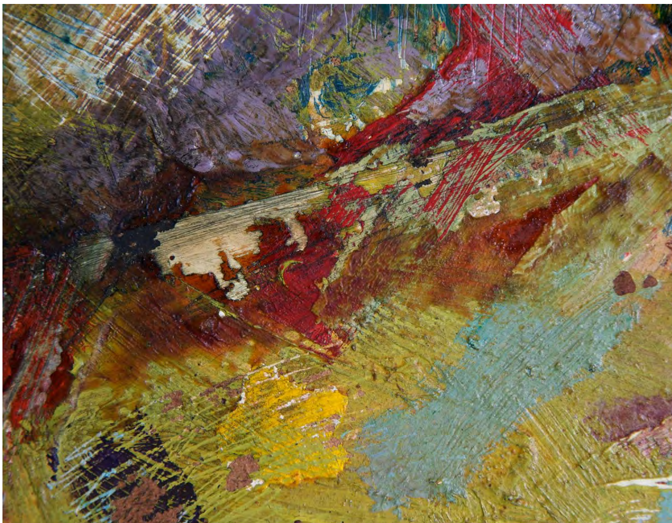
Andrii Pokaz, adobe.com

értelmes tekintete volt. Huncut ugyan, de értelmes és érdeklődő. Fogalmam sincs, valójában mit akart tőlem. Pénzforrásnak vélt vagy más elképzelése is volt? Soha nem derül ki.