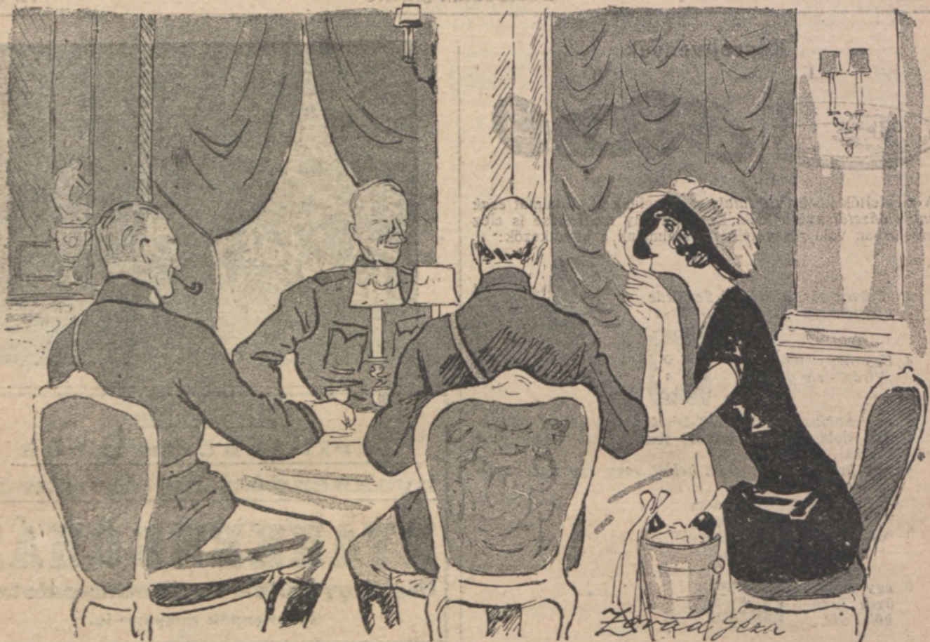
— Voltak tegnap az Operában? ... Mert nem tudom, hogy aki olyan szomorúan énekelt, baritonista volt-e vagy basszista? — Egyik se. Besszista.