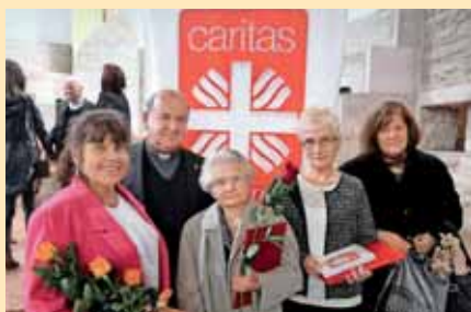
A Katolikus Karitászs a Caritas Hungarica Díjjal ismeri el azon önkéntesek

Ugyancsak közreműködött több más szervezet mellett a Máltai Szeretszolgálat is a bevándorlók megsegítésében, például mobil orvosi rendelőt állítottak szolgálatba a Keleti pályaudvarnál, amikor ott tömegek tartózkodtak. A kormány a Karitatív Tanácson keresztül támogatta ezen szervezetek munkáját.