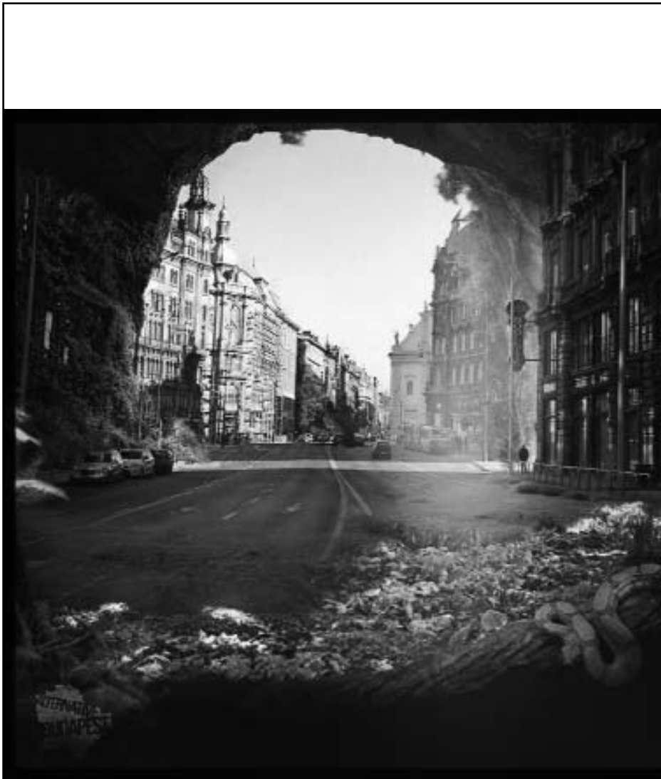
Dzsungel a Ferenciek terén