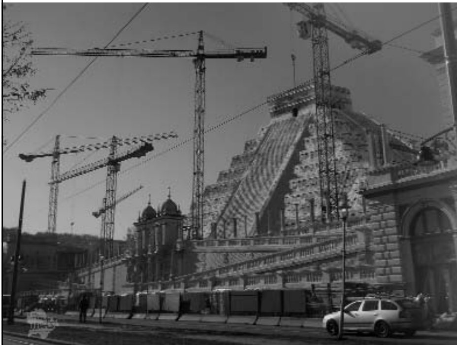
Piramisépítés a Várkert Bazárnál