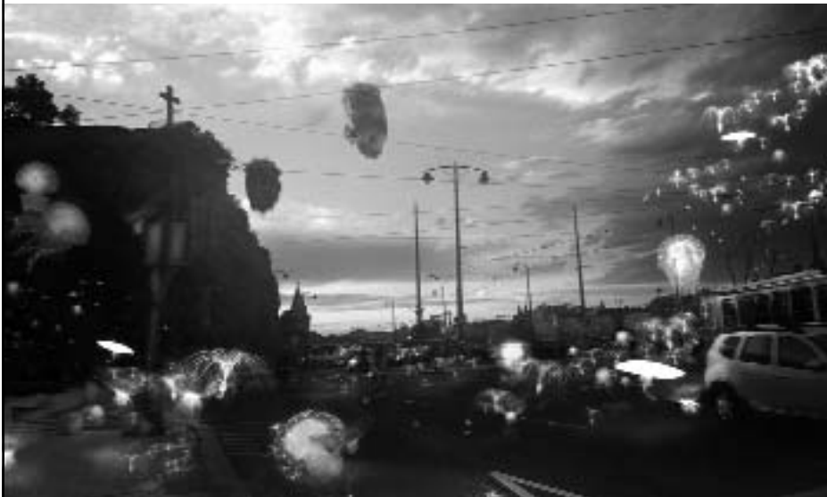
Repülő medúzák a Gellért téren