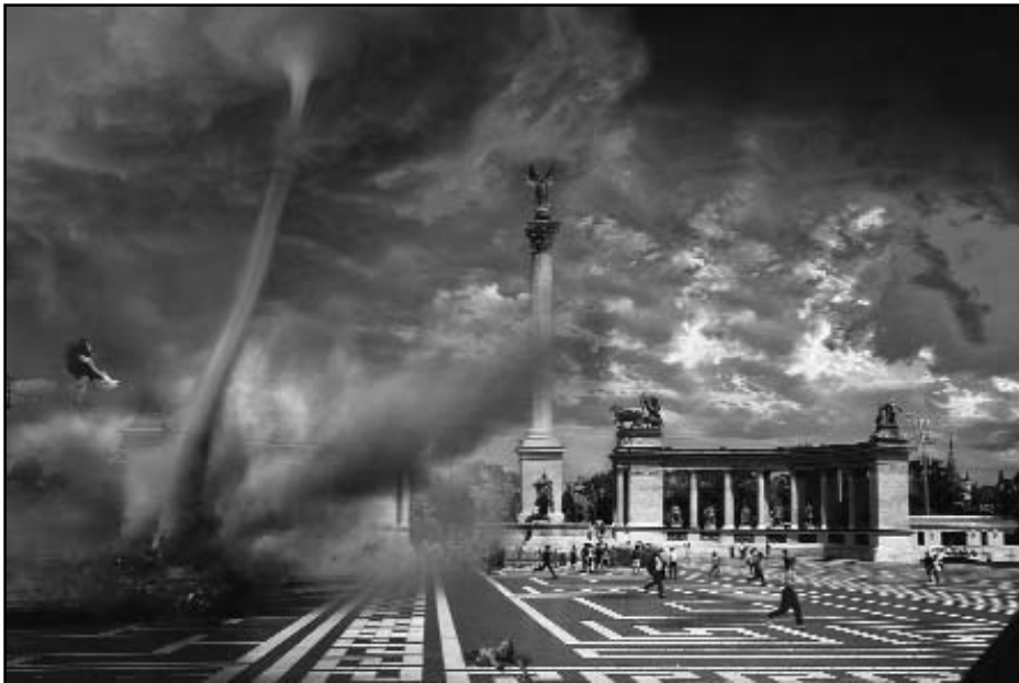
Tornádó a Hősök terénél