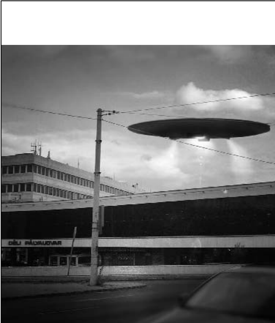
Ufo a Déliné