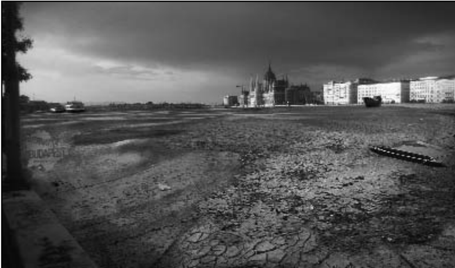
Apadás a Dunán