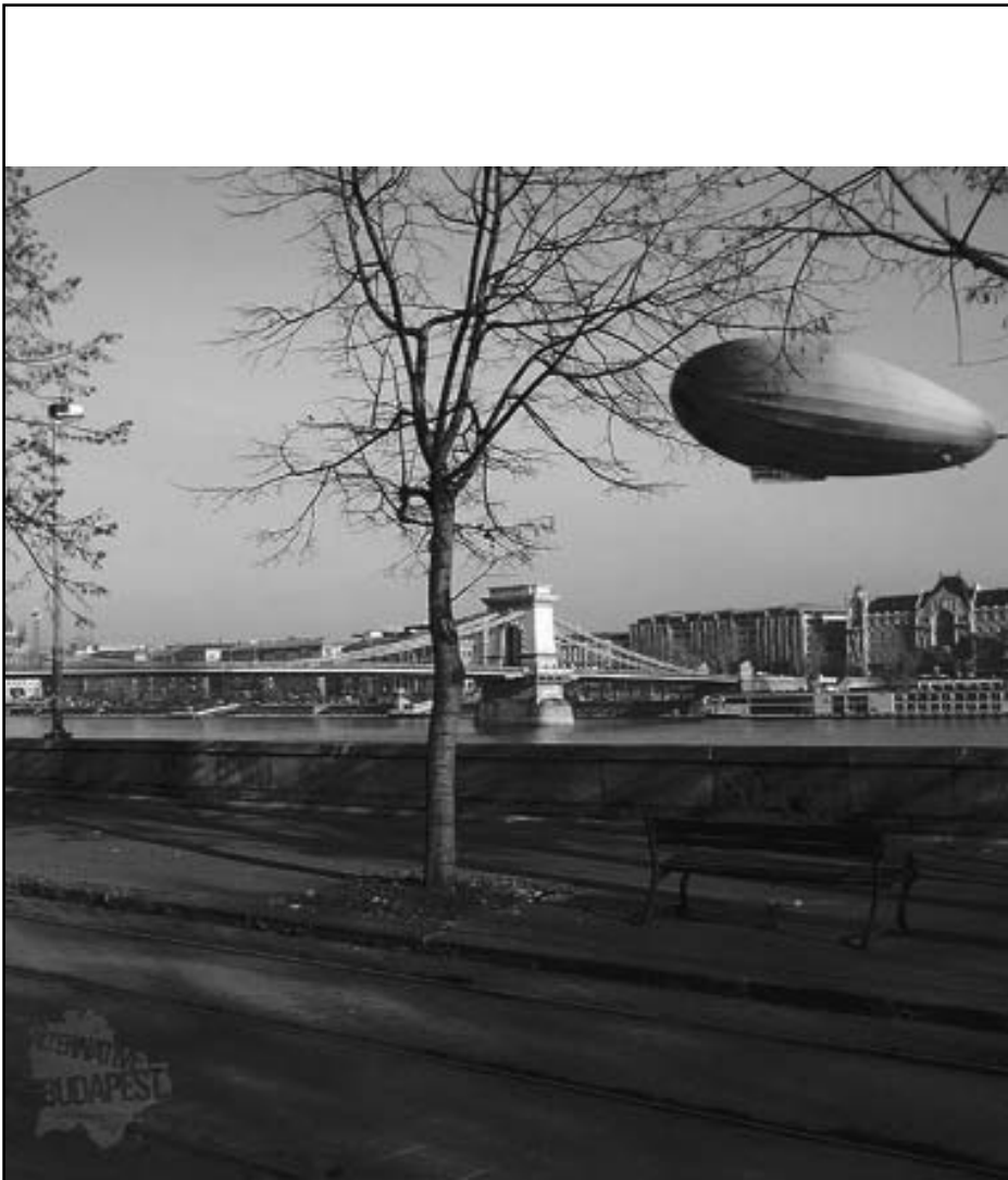
Zeppelin a Duna fölött