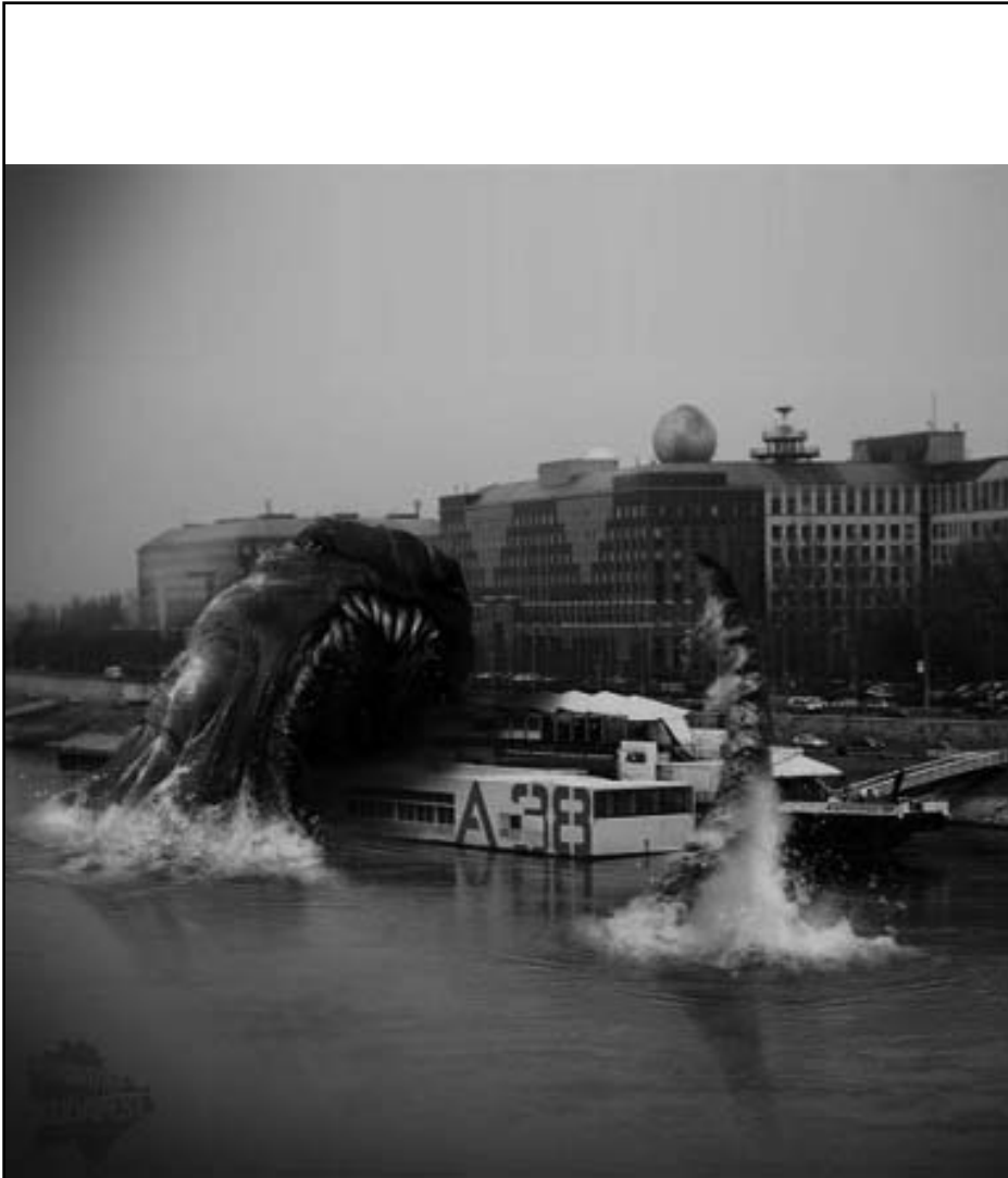
Kraken az A38 hajónál