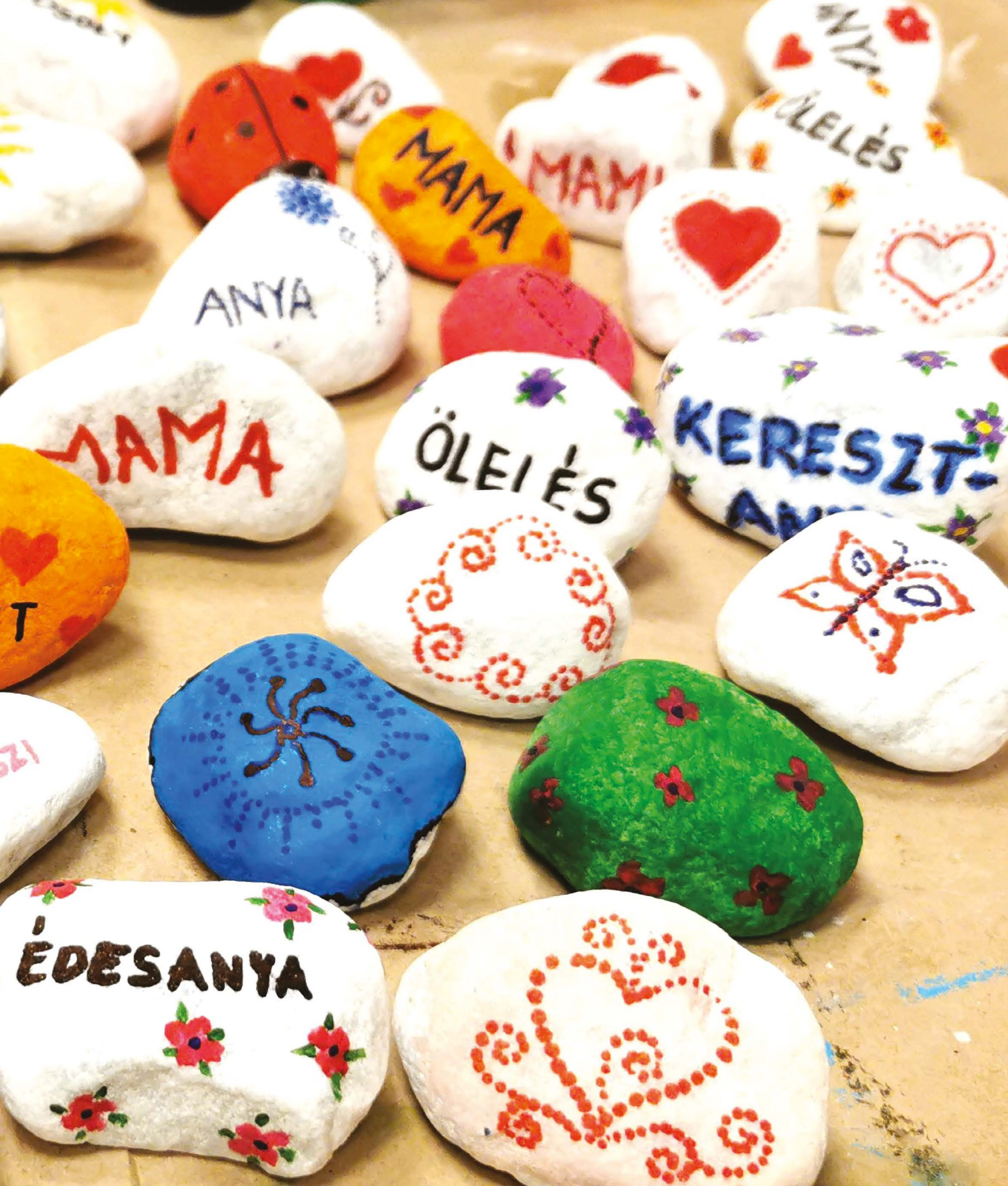
ANYÁK NAPI ÜZENETEK A HEVES MEGYEI SZERETETKÖVEKEN