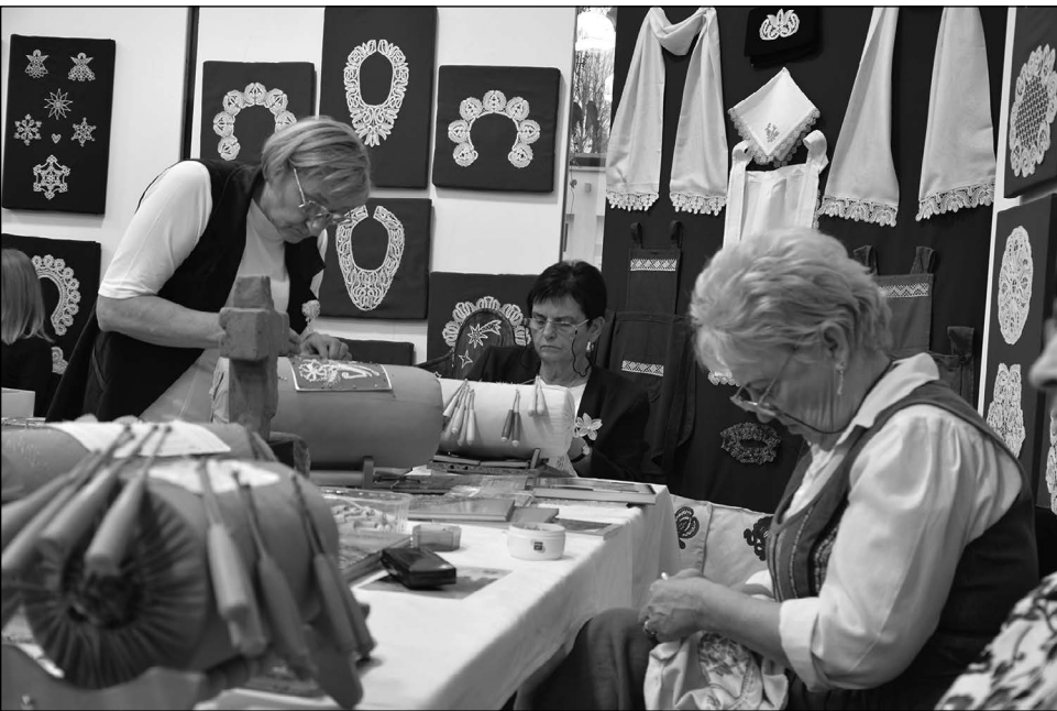
II. Veszprém Megyei Értékünnep, Alsóörs, 2017

2021-ben a pandémia miatt a VI. Veszprém Megyei Értékünnepet online módon rendeztük meg. A jógyakorlatON felületen december elsején „Értékesek vagyunk” címmel egy önálló, tematikus adás keretében kerültek bemutatásra azok az értékfeltáráshoz kapcsolódó legizgalmasabb, legkiválóbb megyei jó gyakorlatok, amelyek mások számára is adaptálható példaként szolgálnak.