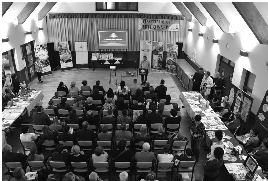
IV. Veszprém Megyei Értékünnep, Bakonybél, 2019