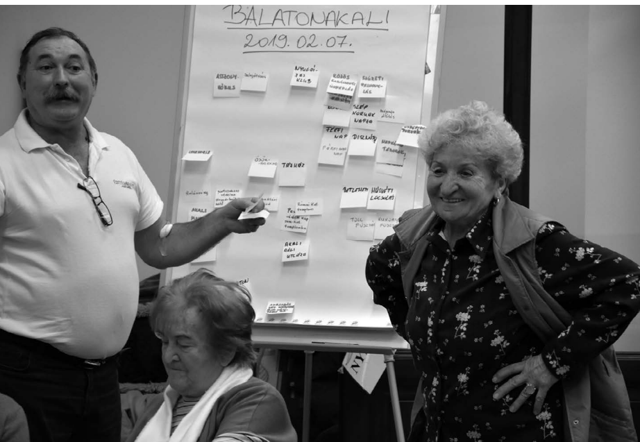
Közösségi beszélgetés Balatonakaliban, 2019