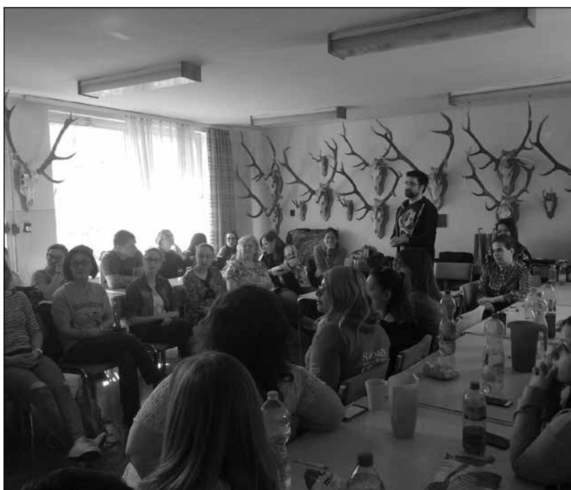
4. kép: Országos Diákköri Konferenciára szánt pályamunka bemutatása a Soó Rezső Kutatóházban