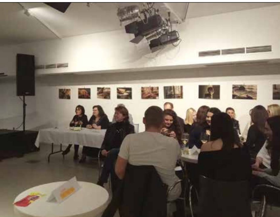
9. kép: Szakeket a Nagyerdei Víztoronyban

megbízásából, és azóta is sikeresen használjuk minden egyetemi rendezvényen. (10. kép)