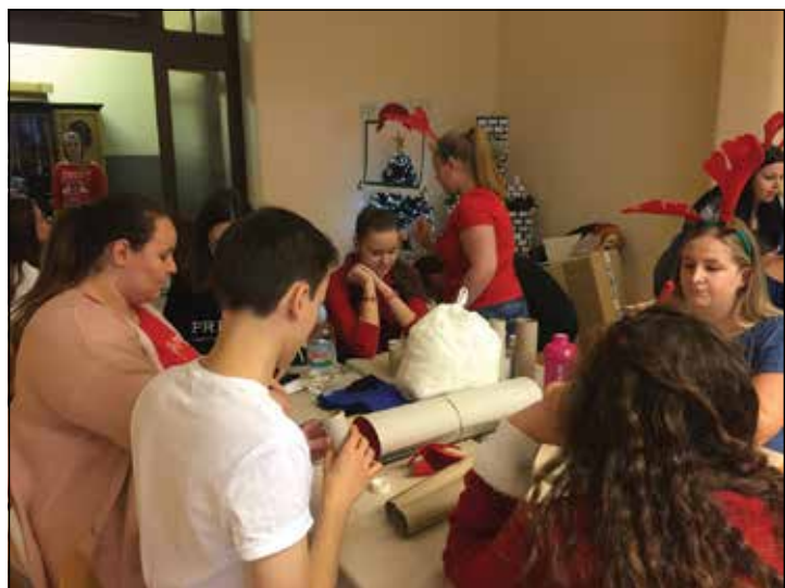
12. kép: Adventi készülődés