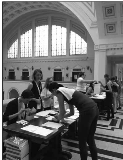
3. kép: Hallgatóink tapasztalatszerzése konferencián

Az oktatás és a kutatás szorosan összekapcsolódó tevékenységekként vannak jelen a Debreceni Egyetemen. Kiemelt feladatnak tekintjük a tehetséggondozást, amelynek több kerete adott hallgatóinknak, így pl. bekapcsolódhatnak a Debreceni Egyetem Tehetséggondozó Programjába (DETEP), valamint a Hatvani István Szakkol-