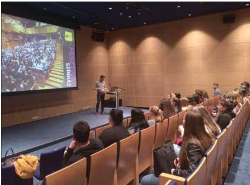
6. kép: Tanulmányi kiránduláson a Művészetek Palotájában

Az együttműködésekben lehetőség nyílik határon túli magyar partnerszervezetekkel kapcsolatba kerülni, oda ösztöndíjasként vagy gyakoronokként bedolgozni, valamint az Erasmus ösztöndíjak segítségével a világ számos pontjára eljuthatnak hallgatóink résztanulmányok teljesítésére Lengyelországtól Spanyolországig, Angliától Koreáig. A számos együttműködésben az elmúlt öt évben kiemelkedő a Nemzeti Művelődési Intézettel való együttműködésünk közös kötetekben, szakmai gyakorlatban, az Intézet által szervezett közös-