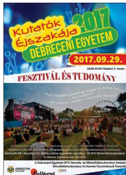
8. kép: Kutatók éjszakája 2017-es tanszéki rendezvényének plakátja

A Debreceni Egyetem középiskolás beiskolázási rendezvényén a DExpo-n is vállalnak feladatokat a hallgatóink, többek között egy egyetemismereti óriás társasjáték játékmesterei. Ezt a társasjátékot egy korábbi, még andragógia szakos évfolyam készítette a Debreceni Egyetem Rendezvénykoordinációs és Alumni Központ