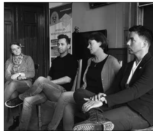
14. kép: Beszélgetés volt hallgatóinkkal és debreceni sikeres vállalkozókkal a munkaerő-piaci elvárásokról