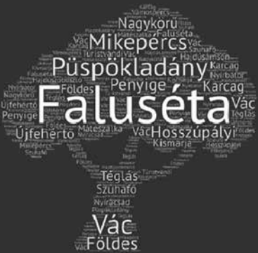
1. kép: Falusétával a településfejlesztésért kötet borítója