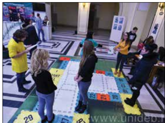
10. kép: Egyetemismereti óriás társasjáték hallgatóink vezetésével

Májusban Szaknapokat szervezünk, általában a harmadéveseink bevonásával. Ebben a programsorozatban kötetlenebb formában szakmai és kulturális programokon is-