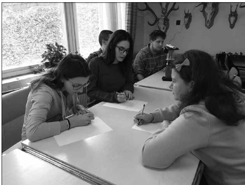
5. kép: Karriertervezési tréning a Soó Rezső Kutatóházban

ményrendszerrel) címmel) nyertessei lehettünk.