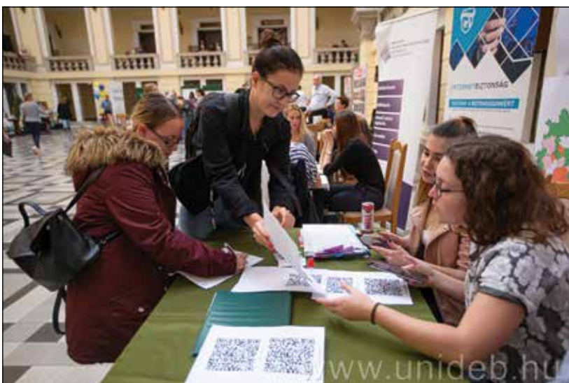
7. kép: Tanulási Fesztiválon a KultúrÁsz Közhasznú Egyesülettel és Nullpont Kulturális Egyesülettel együttműködésben

ségszervezés táborokban, tudományos kutatásokban. Emellett kiemelhetjük a civil szervezetekkel való együttműködések. A Tanszék hallgatói által az 1990-es évek elején alapított Nullpont Kulturális Egyesület munkájába vonjuk be a hallgatókat, valamint számos szervezettel szervezünk közösen programokat, vagy kapcsolódunk be az általuk szervezett tevékenységekbe (pl. KultúrÁsz Közhasznú Egyesület, Köz-Pont Egyesület, Doktoranduszok Kiss Árpád Közhasznú Egyesülete, Életvonal Alapítvány). (7. kép)