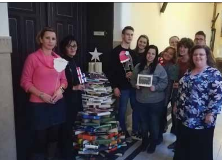
11. kép: A hallgatók által épített könyvfenyő a tanszéki folyosón