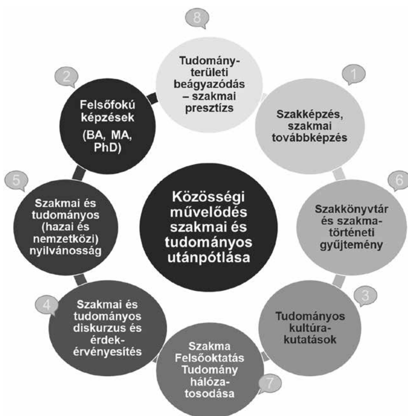
3. ábra: A közösségi művelődés szakmai és tudományos utánpótlás modellje

A képzések perspektivikus fejlesztése a közművelődés szakma jövőjének alapja: a települések fejlődésének alapja a közösségi lét, a közösségek támogatásához pedig szintérre és szakemberre van szükség. Mindennek a folyamatnak az alapja a szakemberek léte, ezért a szakmai és tudományos utánpótlásról való gondoskodás a közművelődési szakmában is meghatározó feladat. A Nemzeti Művelődési Intézet együttműködve a felsőoktatási intézmények hálózatával, a szakmai és tudományos közművelődési hálózatokkal aktívan végzi ezt a folyamatos fejlesztő tevékenységet az alábbi modell alapján. (3. ábra)