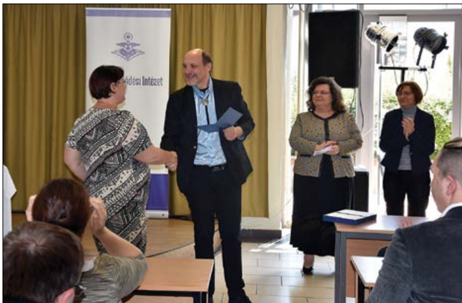
Közművelődési és közösségkapcsolati szakemberképzés tanúsítványátadása Békéscsabán

A Nemzeti Művelődési Intézet egyik legfőbb erőssége a hálózatban rejlik. Működése hálózatos,