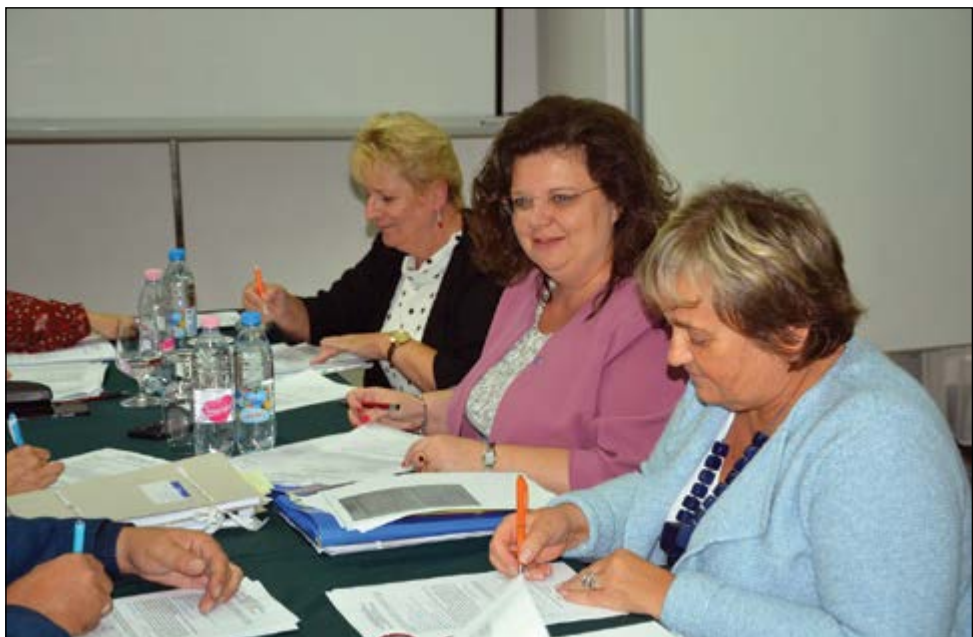
A Magyar Közösségépítők Értékszövetsége Egyesület gyűlése

dr. J. E.: Öt évvel ezelőtt, 2015-ben hívtunk életre egy olyan