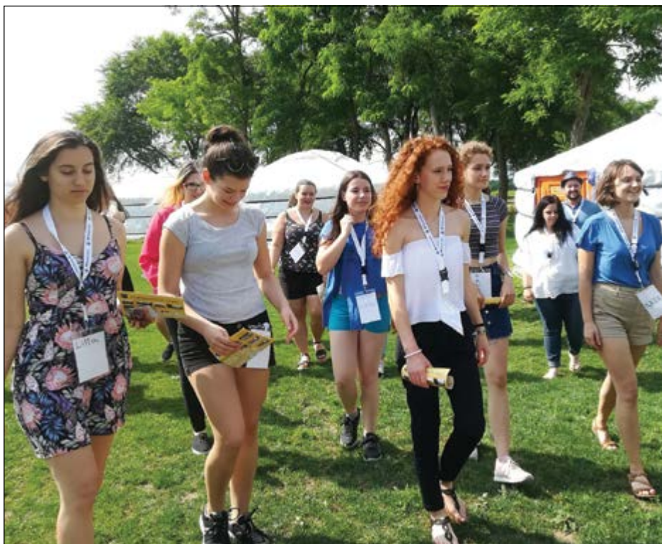
A 2019-es közösség-szervező tábor résztvevői

A közművelődési szakterület fejlesztésének érdekében a Nemzeti Művelődési Intézet 2017-ben országos kutatást végzett – amit azóta is folyamatosan elvégzünk –, amelynek során elkezdtük monitorozni a terület szakember-utánpótlását. Megállapítottuk, hogy azokon a településeken, ahol erős a közösségek, ott sokkal jobb az életminőség, jobb az életszínvonal, nagyobb az elégedettség, a település úgynevezett jóléte. Ahhoz viszont, hogy aktív közösségek működjenek, szükség van egy szintérre, egy intézményre, ahol összejöhetnek. Másrészt szükség