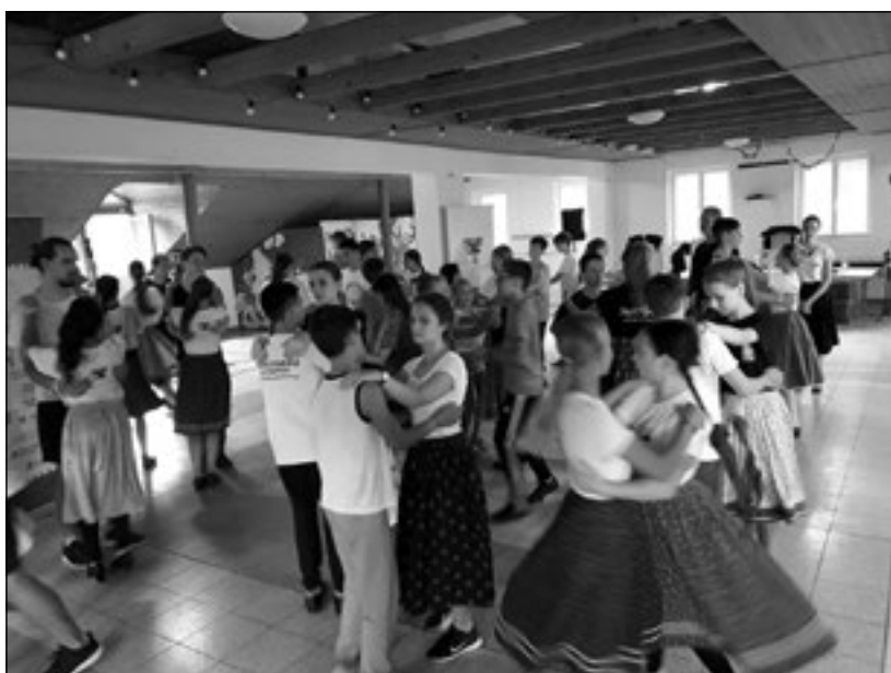
I dance Hungary

A táncművészet világ egyik legfontosabb anyaga, Szatmár tánca került terítékre. Végső Miklós meszt mutatta be a motívumokat és néhány óra alatt azt is elérte, hogy a tanítványok magabiztos, kiváló