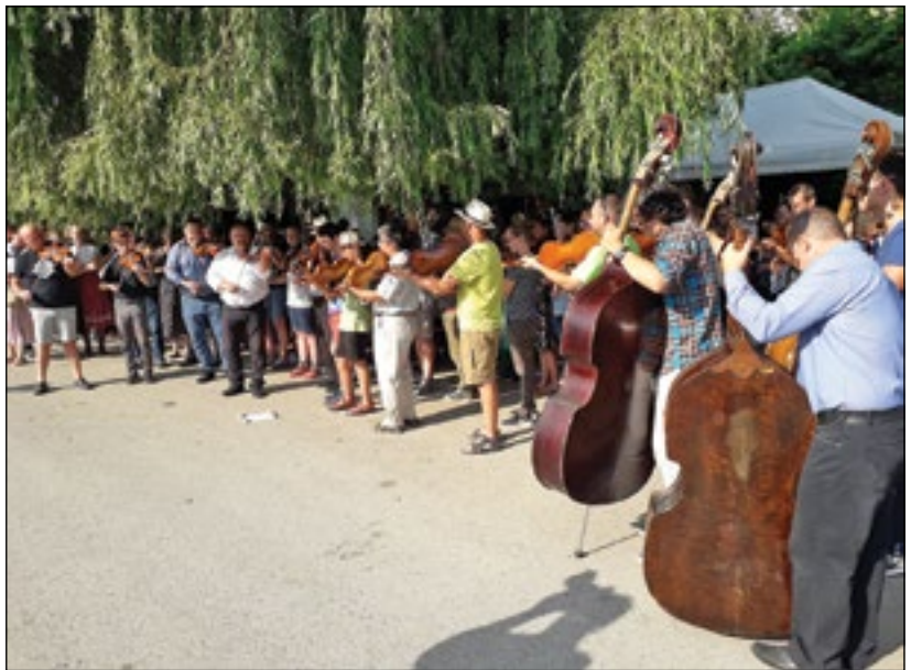
Dűvő Népzenei Tábor

Az érdeklődők a világ különböző részeiről érkeztek. Magyarországról Jászberényből és Szegedről érkezett nagyobb csoport, és sok volt az egyéni érdeklődő. Voltak vendégeink Angliából, Amerikából, Ausztráliából, Kanadából és Európa országából.